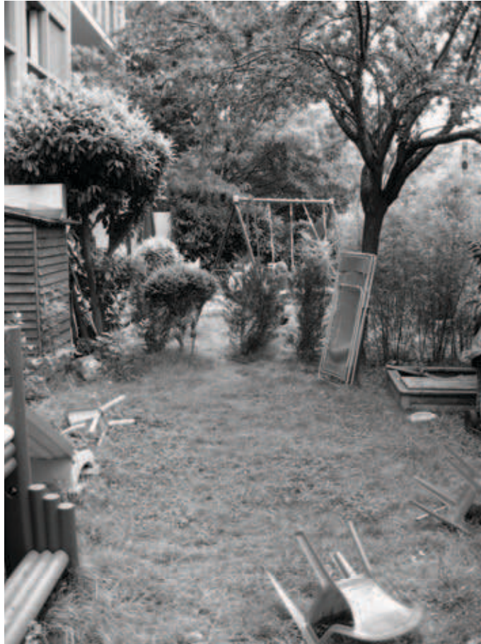
Figure 6 : le jardin de Fabienne et de sa voisine, vue sur la haie recomposée pour permettre le passage des enfants d'un jardin à l'autre

L'ouverture du jardin dont nous venons de discuter concourt à tisser des relations privilégiées entre voisins à l'échelle interindividuelle.