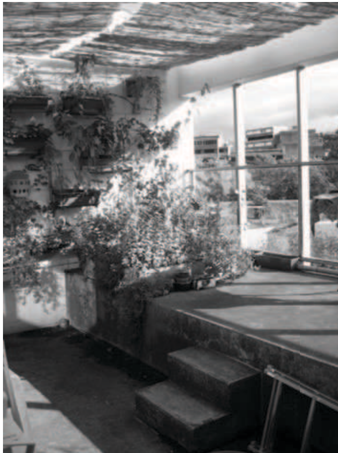
Figure 2 : le jardin coquille de Françoise

mais aussi des pièces qui la jouxtent, Françoise a installé sur celle-ci trois dispositifs : des massifs mêlant plantes ornementales (vivaces et annuelles) et potagères dans des bacs sur la partie haute, des canisses en vélum et a recouvert ses murs de plantes grimpantes (un jasmin d'hiver, un chèvrefeuille, une vigne et un rosier grimpant). Ces dernières viendront à terme remplacer les canisses en vélum. Françoise s'est ainsi créée une coquille qui la protège sans pour autant la couper définitivement des espaces extérieurs à sa terrasse. Elle aime d'ailleurs beaucoup s'installer sur la partie haute de sa terrasse, pour lire, prendre l'apéritif entre amis ou tout simplement pour profiter de la vue sur le parc et sur les jardins des voisins. La disposition de sa terrasse sur deux niveaux accompagne par ailleurs ce repliement relatif : pour prendre un bain de soleil et baigner sa fille dans sa petite piscine en forme de coquillage sans qu'elles soient vues, Françoise se met sur la partie basse de sa terrasse. Il lui suffit, quand elle le souhaite, de gravir quelques marches pour se reconnecter avec l'extérieur.