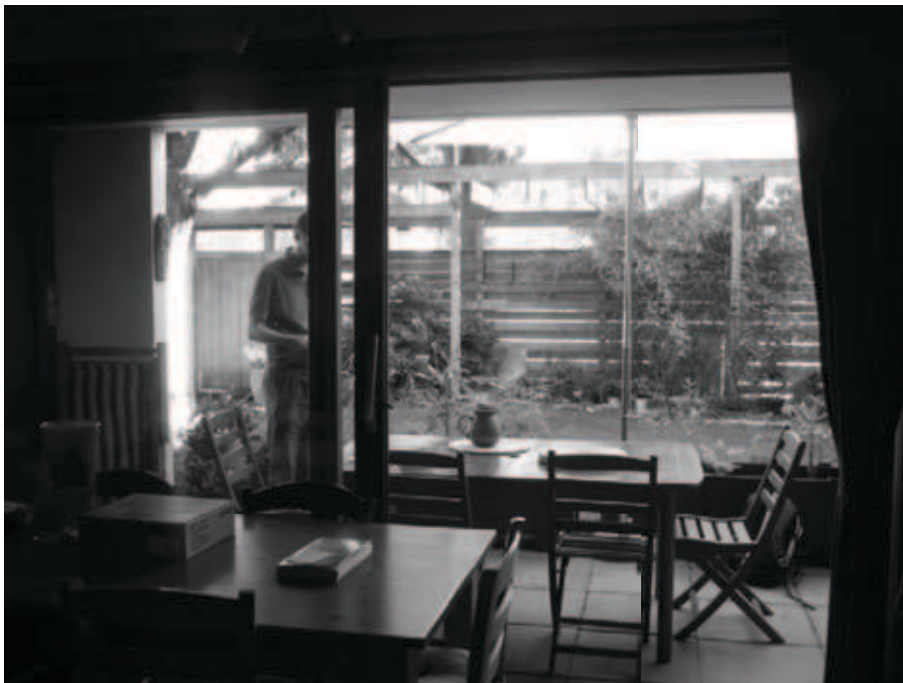
Figure 4 : le jardin prolongement de Claudine

L'ouverture du logement vers le jardin et parfois même du jardin vers les espaces collectifs ou publics qui le bordent peut se faire à travers la transposition des usages et à travers des mises en vue de l'intérieur vers le jardin et du jardin vers l'extérieur. Claudine (Figure 4) loue un logement social disposé en bande et en vis-à-vis avec les logements voisins. Elle possède un jardin de pleine terre, de cinquante mètres carrés. Claudine a disposé de part et d'autre de la façade, deux tables qui se répondent l'une l'autre et qui accueillent les repas en fonction de la météo. Elle dit avoir conçu son jardin comme une succession de lignes - matérialisées par des massifs disposés en pleine terre ou dans des bacs - qui accompagnent le regard, mais aussi au sens large l'attention sensible de la jardinière, de l'intérieur à l'extérieur. Son jardin est un prolongement de son logement. Claudine dit être en contact avec son jardin toute l'année, elle le regarde, le sent, l'écoute au fil de saisons. Elle nous précise que cette succession de lignes engage un mouvement du corps de l'intérieur vers l'extérieur afin d'aller jardiner plutôt qu'une contemplation distanciée du jardin.