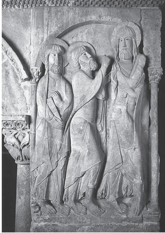
FIG. 1. – La marche des disciples d'Emmaüs à la suite du Christ. San Domingo de Silos, haut-relief d'un pilier du cloître, première moitié du XII e siècle.

a, pour la première fois peut-être sous une forme aussi imposante, saisi dans cette figure offerte aux regards des moines l'image que les commentateurs des évangiles avaient les premiers suggérée dans leurs explications minutieuses de la rencontre entre Jésus ressuscité et deux de ses disciples – Cléophas, et peut-être Luc 2 –, sur le chemin d'Emmaüs. Il était apparu à leurs yeux, observaient-ils, in specie peregrini 3 . Faut-il traduire : sous l'apparence d'un « pèlerin »,