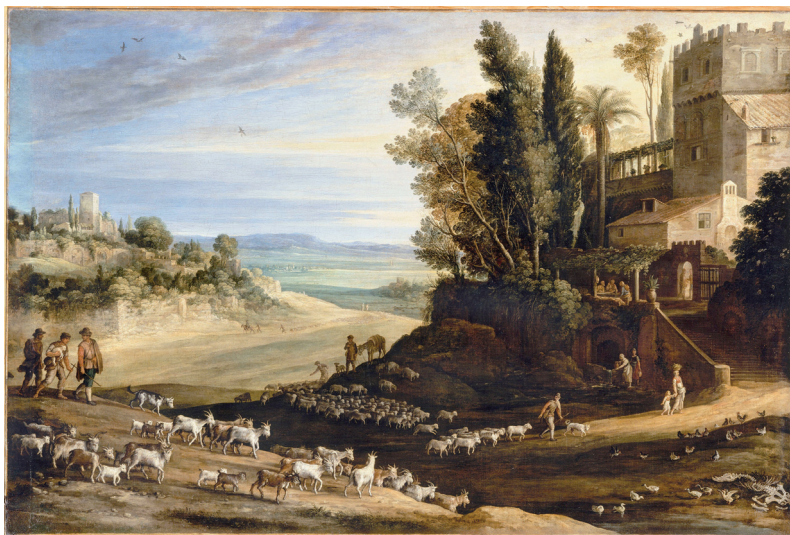
FIG. 17. – Paysage avec les pèlerins d'Emmaüs . Paul Bril, toile, 142 x 95 cm, 1617. Paris, Musée du Louvre.

aux yeux de l'artiste, ou plutôt le paysage, à la peinture duquel le cheminement des trois pèlerins vers Emmaüs offre un merveilleux prétexte ? La toile de Paul Bril (fig. 17) en est un bon exemple. La figure du Christ pèlerin, indéniablement, a moins bien résisté à l'usure des siècles que celle de saint Jacques 76 . Comme les peintres, les prédicateurs des Temps modernes la négligent. Un Lorenzo de Brindisi, à la fin du XVI e siècle, est plus inspiré, quand il prêche le lundi de Pâques, par le long dialogue engagé par Jésus sur le chemin d'Emmaüs avec les deux disciples, occasion pour ce Capucin de discerner dans le Christ une figure idéale de prédicateur 77 . Peu à peu, sous le pinceau des peintres, le Christ a en outre perdu tous les signes visibles de l'état de pèlerin, pour ne plus figurer que comme le Dieu des chrétiens qui se révèle à la fraction du pain, sous les yeux enfin dessillés des deux disciples qui, eux, avec ou sans l'habit de pèlerin, maintiennent encore discrètement dans nos mémoires