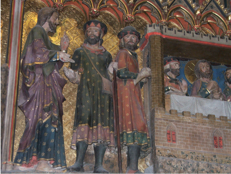
FIG. 13. – L'entrée à Emmaüs et le repas. Paris, cathédrale Notre-Dame, clôture du chœur, début du XIV e siècle.