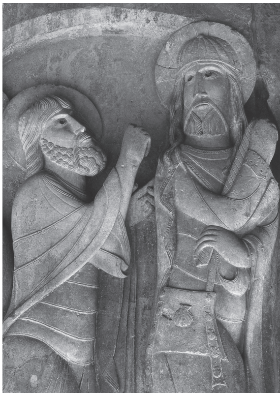
FIG. 2. – Le Christ pèlerin (détail). San Domingo de Silos, haut-relief d'un pilier de cloître, première moitié du XII e siècle.

ou d'un « étranger » ? L'ambivalence du sens parcourt nombre de textes, conciliant l'héritage du latin classique de la romanité et les usages renouvelés de ce mot au cours du Moyen Âge 4 . Elle n'est plus