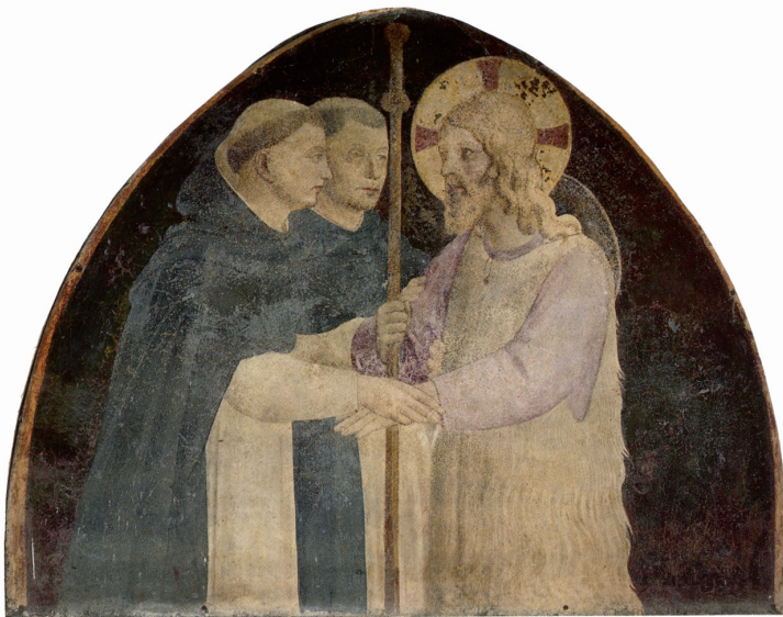
FIG. 14. – Deux frères dominicains accueillent le Christ pèlerin. Florence, cloître de San Marco, lunette peinte par Fra Angelico, XV e siècle.