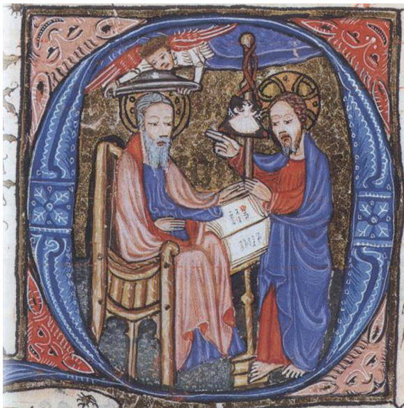
FIG. 10. – Le Christ transmet à saint Jacques les insignes du pèlerin. Rituel à l’usage du prévôt de l’église Saint-Pierre-sur-la-Lys, vers 1412. Paris, BnF, Nouv. Acq. Lat. 3106, f. 38.