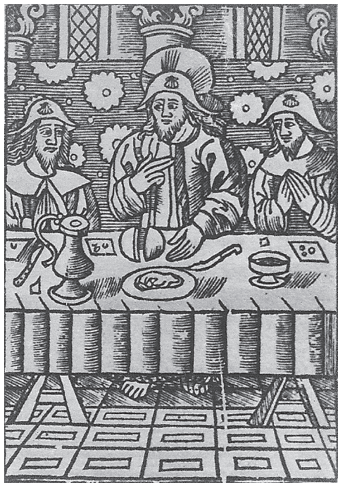
FIG. 15. – Anonyme, Le repas d'Emmaüs . Gravure sur bois, école française du XV e siècle (d'après R. Rudrauf, Le repas d'Emmaüs , Paris, 1955).

Sans doute, la tradition narrative représentée par le Psautier de Saint-Albans, dont l'objectif était de déployer en scènes successives les moments essentiels de la péripécie d'Emmaüs évoqués dans le jeu du Peregrinus , ne s'est pas éteinte. Au début du XVI e siècle, le retable de Montbéliard (fig. 16) l'atteste. Son ambitieux programme vise à raconter en cent cinquante-sept panneaux distribués autour de la crucifixion toute l'histoire des évangiles. Sur l'un de ces petits