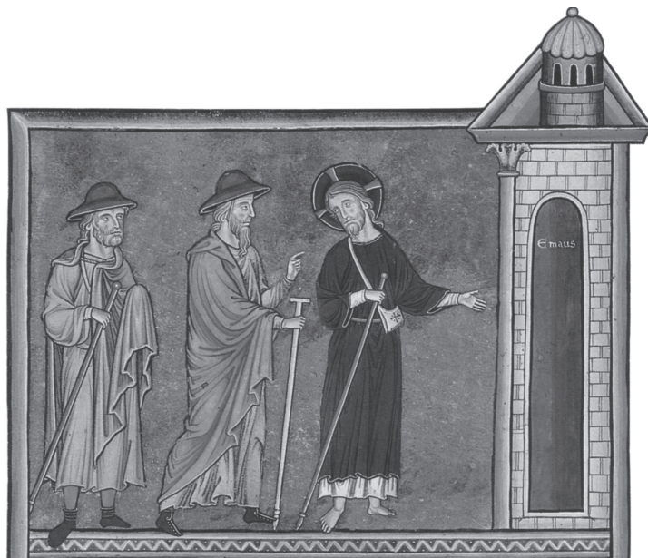
FIG. 4. – L'entrée du Christ et des deux disciples à Emmaüs. Psautier d'Ingeburge, début du XIII e siècle. Chantilly, Musée Condé, ms. 9, f. 30v.