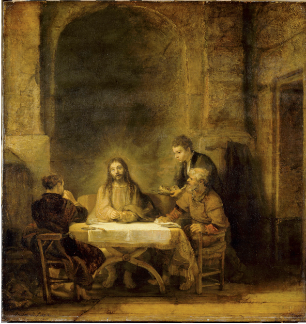
FIG. 18. – Les pèlerins d'Emmaüs . Rembrandt, toile, 61 x 68 cm, 1648. Paris, Musée du Louvre.

la tradition vivace qui avait uni l'épisode d'Emmaüs à la spiritualité du pèlerinage. Les sobres toiles, toutes en intériorité retenue (fig. 18), que Rembrandt a maintes fois consacrées à ce sujet, ne sont-elles pas universellement connues sous le nom des « Pèlerins d'Emmaüs » ?