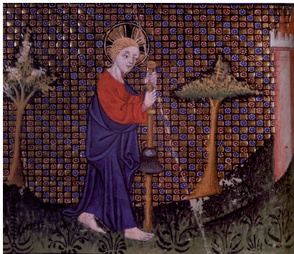
FIG. 11. – Le Christ pèlerin marche vers la Jérusalem céleste. Guillaume de Digulleville, Le pèlerinage du Christ , XIV e siècle. Paris, Ste Geneviève 1130, f.159.