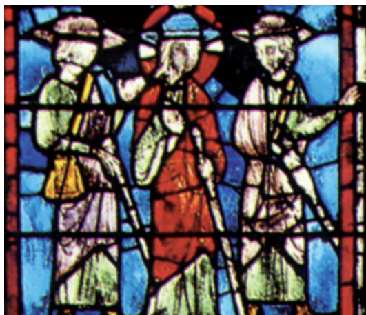
FIG. 5. – Le Christ et les disciples sur la route d'Emmaüs. Paris, Sainte-Chapelle, vitrail (détail), milieu du XIII e siècle.