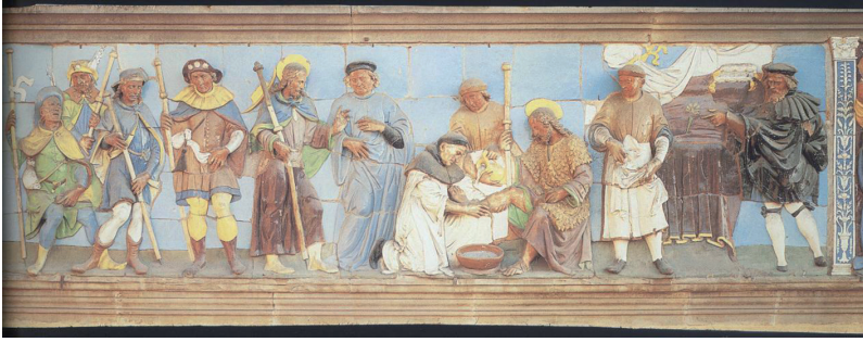
FIG. 7. – L'accueil des voyageurs à l'hôpital. Pistoia, Ospedale del Ceppo, panneau de faïence (5,12m x 1,37m), début du XVI e siècle.

immenses panneaux des ses volets latéraux, la scène rare du saint évêque pratiquant l'hospitalité envers un hôte qui n'est autre que le Christ (fig. 8) 24 . Il convient d'observer que les gestes du lavement des pieds et de l'agenouillement, communs aux deux scènes d'hospitalité que nous venons de considérer, suggèrent encore une fois un rapprochement, qui n'existe que dans les images, avec la pratique du mandatum .