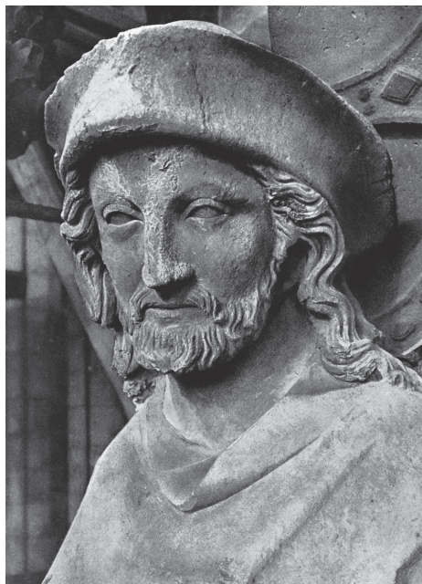
FIG. 6. – Le Christ pèlerin (détail). Reims, façade occidentale de la cathédrale, sculpture du milieu du XIII e siècle. Photographie prise avant l'incendie de 1917 (d'après W. Sauerlander).