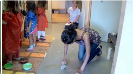
Figure 4 – 00:45:38

REF attire l'attention de STA sur la présence de taches de peinture sur le sol