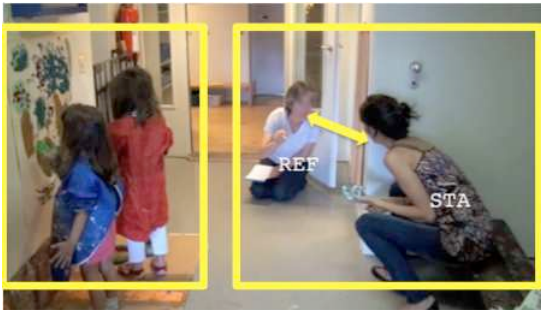
Figure 3 – 00:45:24

REF attire l'attention de STA sur la présence de taches de peinture sur le sol