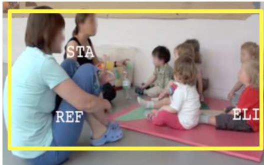
Figure 5 - 00:33:50 STA donne les consignes aux enfants ; REF intervient auprès d'ELI