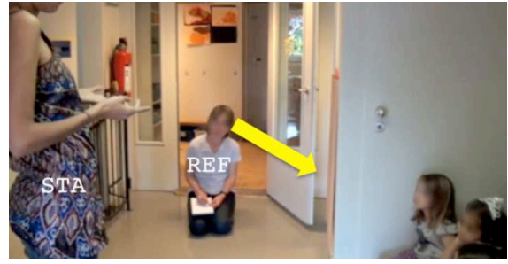
Figure 2 - 00:34:23 STA donne les consignes ; REF regarde en direction des enfants.

Figure 1: STA finishes to read the book; REF looks towards STA