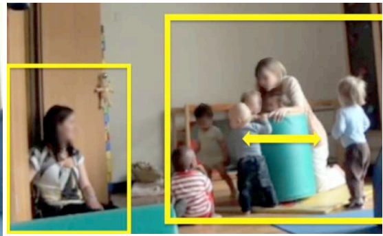
Figure 10 : 00:37:37 REF fait tanguer le cylindre en chantant la chanson du bateau

Figure 9: STA observes how REF places LUD inside the cylinder