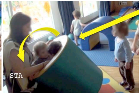
Figure 12 : 00:55:47

Figure 11: STA tries to place the cylinder around LUD