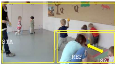
Figure 7 – 00:34:44 STA initie l'activité pendant que REF invite ISA à prendre part au jeu

Figure 7: STA initiates the bowling game while REF brings ISA back into the group