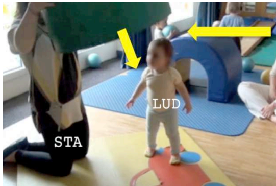
Figure 11 : 00:55:04

STA essaye de placer le cylindre autour de LUD