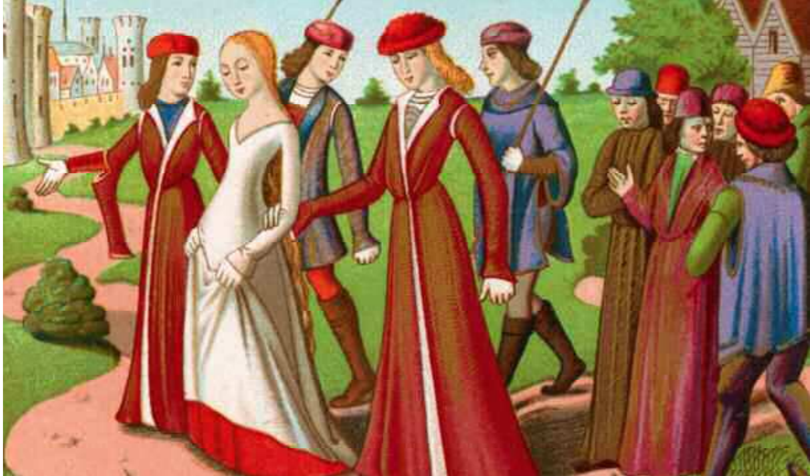
Jeanne d'Arc au château de Chinon avant sa rencontre avec le dauphin, elle est avec Jean de Metz et Bertrand de Poulengy. Enluminure extraite de « Les Vigiles de Charles VII » de Martial d'Auvergne, 1484.