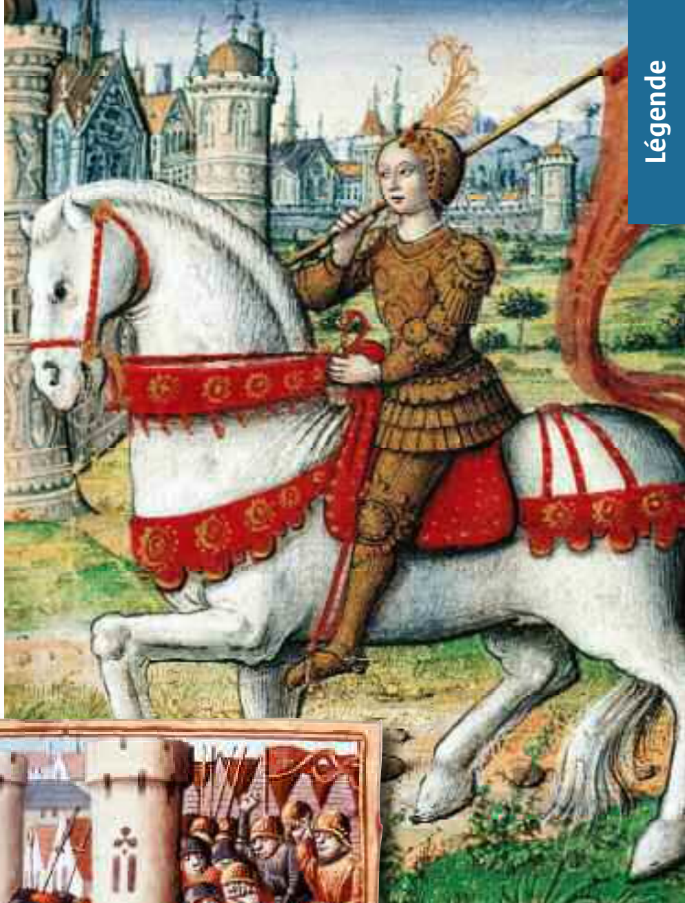
Jeanne d'Arc. Miniature tirée de « La vie des femmes célèbres » d'Antoine Dufour, 1505 environ. (Nantes, musée Thomas)

Une lettre d'un Vénitien vivant à Gênes est envoyée dans la cité maritime le 1 er août 1429, un mois après