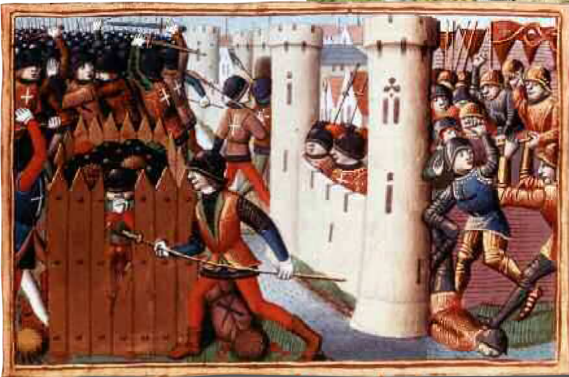
Les Français lèvent le siège d'Orléans et entrent dans la ville le 8 mai 1429. Manuscrit de Martial d'Auvergne. « Vigiles de Charles VII » (Paris, BNF)

le sacre de Charles VII. Les nouvelles sont si étonnantes que leur contenu finit par échapper à toute rationalité :