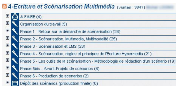
fig 2 : forme thématique

D'autre part une forme thématique, l'enseignant utilise alors la forme de l'atelier pour organiser le savoir, on trouve dans celui-ci des listes thématiques où les contributeurs sont autant l'enseignant que les étudiants : « Phase 1 retour sur la démarche de scénarisation, phase 2 etc... » cf fig 2