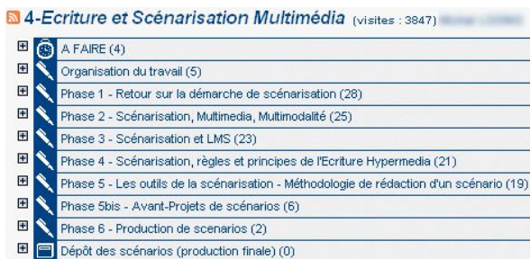
fig 2 : forme thématique

D'autre part une forme thématique, l'enseignant utilise alors la forme de l'atelier pour organiser le savoir, on trouve dans celui-ci des listes thématiques où les contributeurs sont autant l'enseignant que les étudiants : « Phase 1 retour sur la démarche de scénarisation, phase 2 etc... » cf fig 2