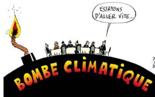
Dessin n°1 : Dessin de presse distribué aux élèves (séance sur le changement climatique).

L'enseignant commence la séance en présentant aux élèves un dessin de presse (dessin n°1) :