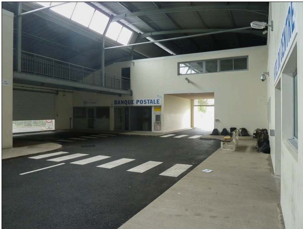
Illustration 6 - L'espace de simulation

L'usage de dispositifs virtuels, que ce soit des simulateurs ou ce type d'espace, n'est pas neuf, et l'armée américaine a largement contribué à développer des outils d'entraînement de plus en plus sophistiqués, qui font la part belle à la mise en situation, sous forme de jeu de rôle (Halter, 2006). Lorsque nous avons mené nos entretiens, à plusieurs reprises dans la conversation entre les officiers, il a été question d'insérer des nouvelles technologies dans les scénarios (drone notamment).