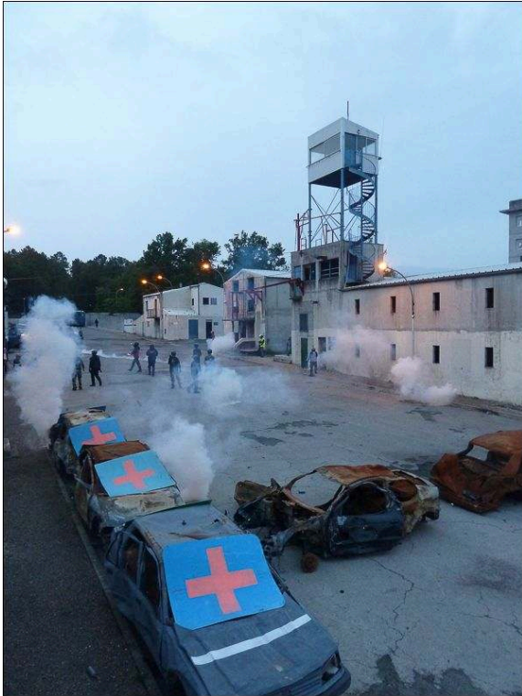
Illustration 4b - Le Boulevard des légions de nuit lors d'un exercice de rétablissement de l'ordre

Auteurs : A. Goreau-Ponceaud et E. Ponceaud-Goreau, 2014.