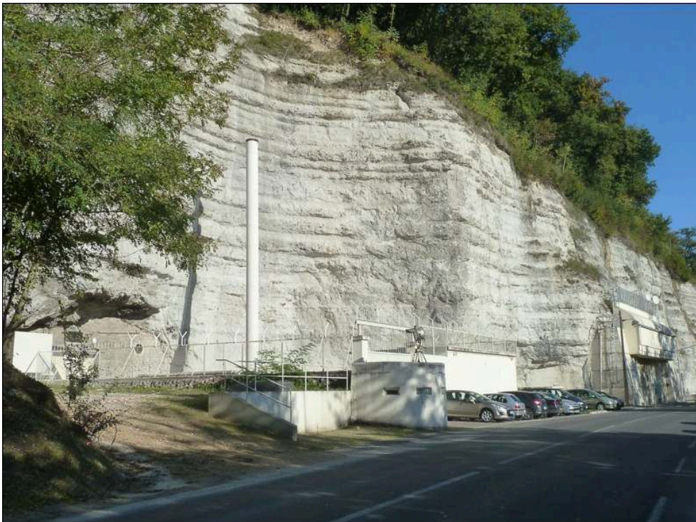
Illustration 1 - Anciennes carrières abritant le 13 ème BS Mat

Au premier plan la RD3. Creusés dans les falaises calcaires, les anciens fours à chaux qui hébergent le 13 ème BS MAT. Sur les hauts, le CNEFG.