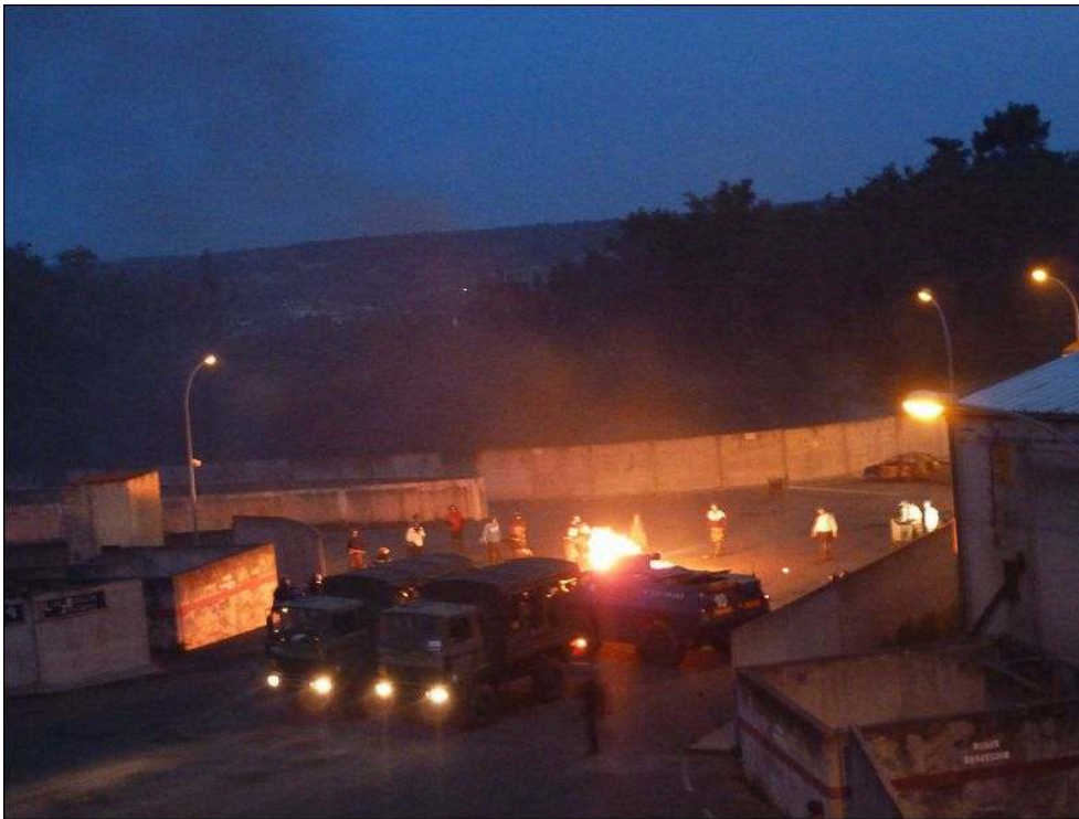
Illustration 5 - La ville lors d'un exercice nocturne de rétablissement de l'ordre