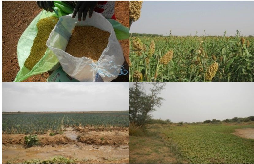
Fig. 3 : De gauche à droite : Sac de riz récolté dans un P.I.V à Ndiawara (novembre 2012) ; Sorgho cultivé en décrue ( walo ) à Gamadji Saré (février 2013) ; Production d'oignons en parcelle irriguée à Diomandou (mars 2012) ; Patate douce sur berge ( falo ) à Guia (mars 2012)