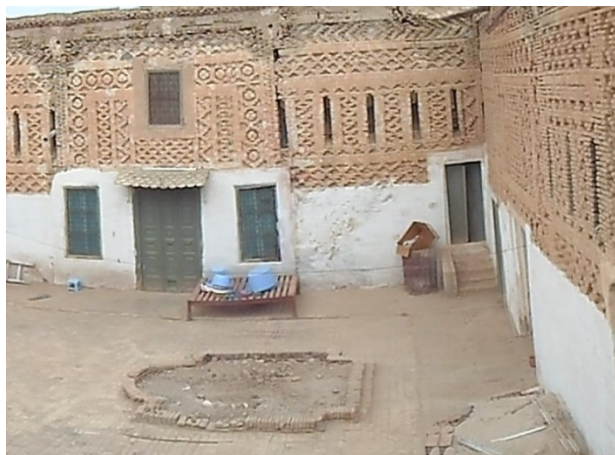
Figure 4 : maison traditionnelle à Nefta Guedria, Mars 2013