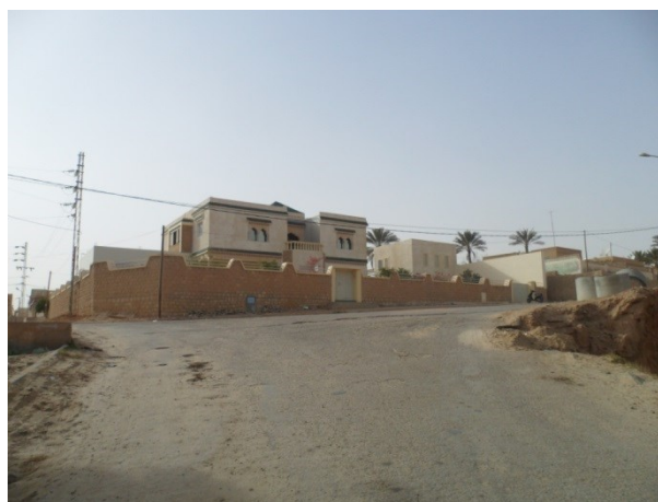
Figure 3 : rue et maison dans un quartier nouveau Guedria, Mars 2013

Les îlots sont généralement de formes irrégulières. Les constructions sont accolées les unes aux autres, où une seule façade donne sur la rue et qui permet l'accès à l'espace.