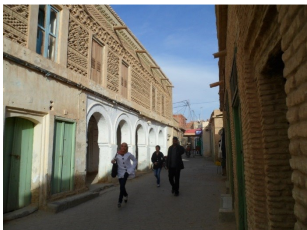
Figure 2 : rue dans la ville traditionnelle Guedria, Mars 2013

Les rues de la nouvelle ville sont de largeurs plus importantes que la hauteur des bâtiments qui les entourent, afin de permettre la circulation véhiculaire, et faciliter l'accès aux différentes maisons (Figure 3). La forme urbaine permet de créer des perspectives et plus de visibilité. Ce rapport ne favorise pas la création de zones ombragées, surtout en l'absence totale de passages couverts.