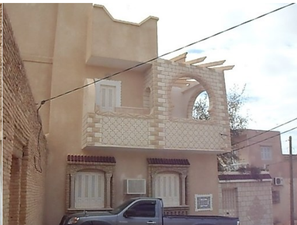
Figure 5 : villa moderne à Nefta Guedria, Mars 2013