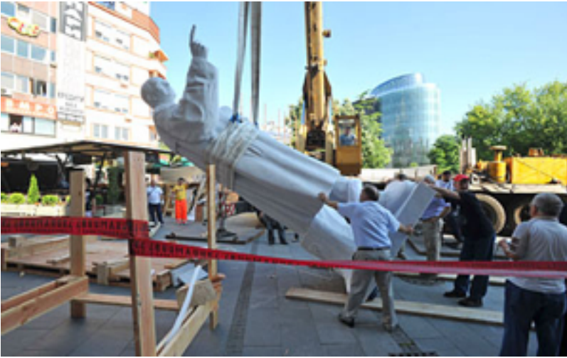
Statue de Metodija Andonov Čento

Statue de Metodija Andonov Čento (premier président de l'Assemblée de l'ASNOM – Assemblée antifasciste de libération populaire de Macédoine) inaugurée sur la place centrale de Skopje le 7 juin 2010. Pour un coût d'1,1 million d'euro, la statue de marbre pèse 2,5 tonnes, mesure 5 m de hauteur auxquels s'ajoutent les 2,5 m du piédestal.