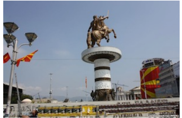
Statue d'Alexandre le Grand

Statue de Metodija Andonov Čento (premier président de l'Assemblée de l'ASNOM – Assemblée antifasciste de libération populaire de Macédoine) inaugurée sur la place centrale de Skopje le 7 juin 2010. Pour un coût d'1,1 million d'euro, la statue de marbre pèse 2,5 tonnes, mesure 5 m de hauteur auxquels s'ajoutent les 2,5 m du piédestal.