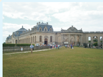
J.-B. GRISON, juillet 2010