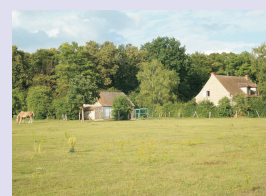
J.-B. GRISON, juillet 2010

Lotissement du Lys - Lamorlaye : 1 640 parcelles sur 700 hectares