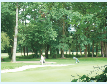
J.-B. GRISON, juillet 2010

Les activités sportives liées aux pratiques équestres ainsi qu'au golf sont également très présentes.