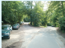
J.-B. GRISON, juillet 2010

Stationnement de promeneurs en forêt de Chantilly