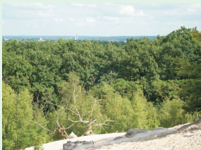
J.-B. GRISON, juillet 2010

Les Trois Forêts ont été classées, dès 1960 pour le domaine de Chantilly, dans les années 1990 pour les autres. Leur périphérie sud a adopté cette disposition en 2002.