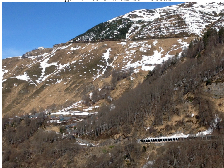
Fig. 2 : Les Chalets de l'Ossau