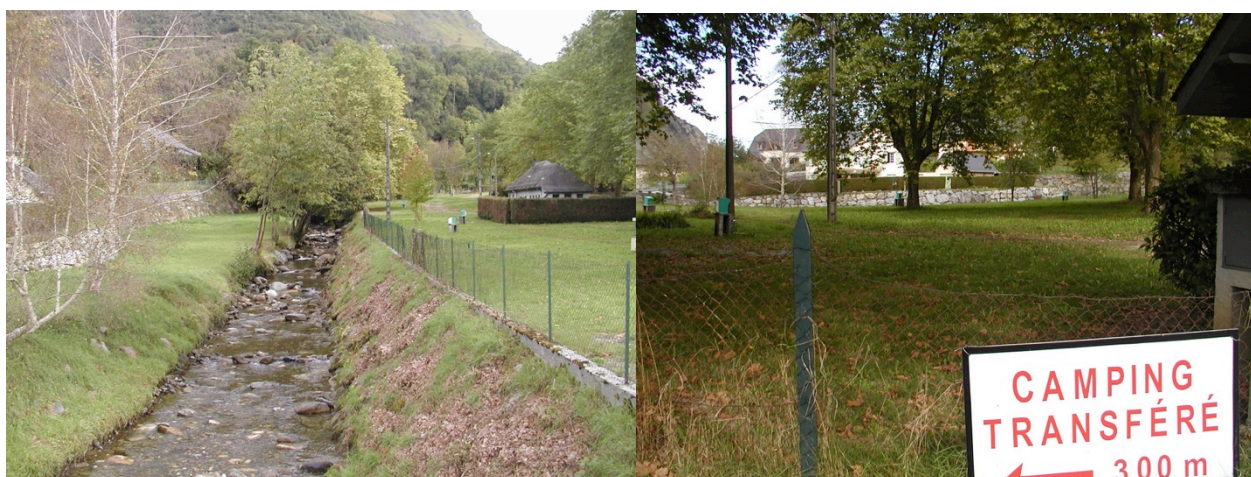
Fig.4 : Le camping de Beost : ignorance, résistance puis fermeture du camping