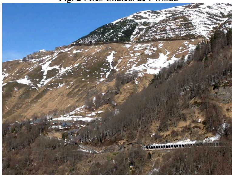
Fig. 2 : Les Chalets de l'Ossau