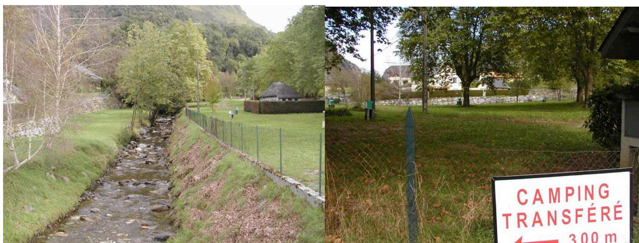
Fig.4 : Le camping de Beost : ignorance, résistance puis fermeture du camping