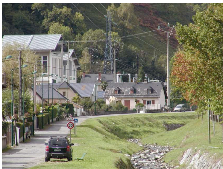
Fig. 3 : Cours moyen de L'Arrieussé à Laruns