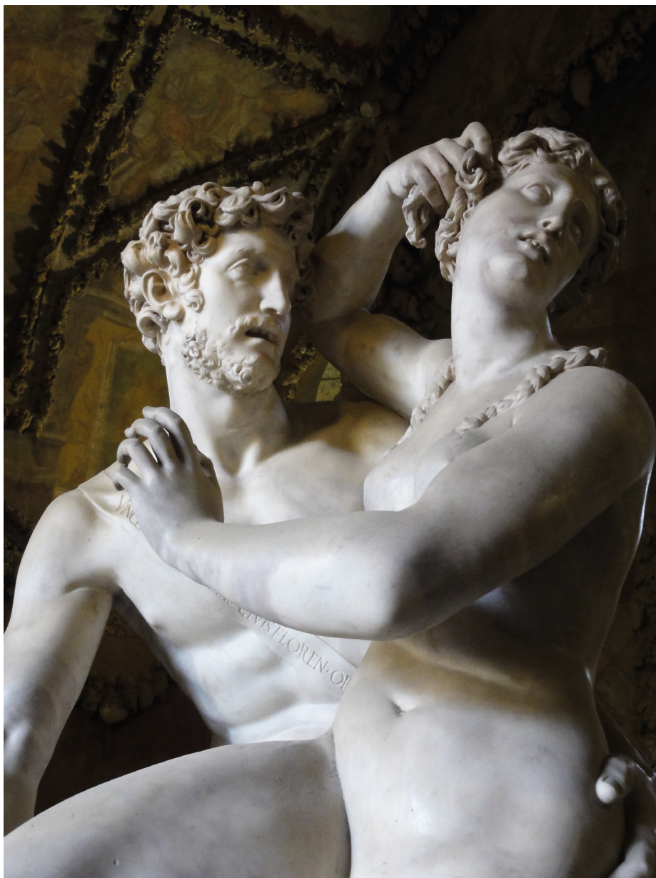
Fig. 7. VINCENZO DE' ROSSI, Pâris ravissant Hélène , exécuté vers 1558, installé en 1586, marbre, Florence, jardin de Boboli, Grande Grotte, entrée de la deuxième salle.