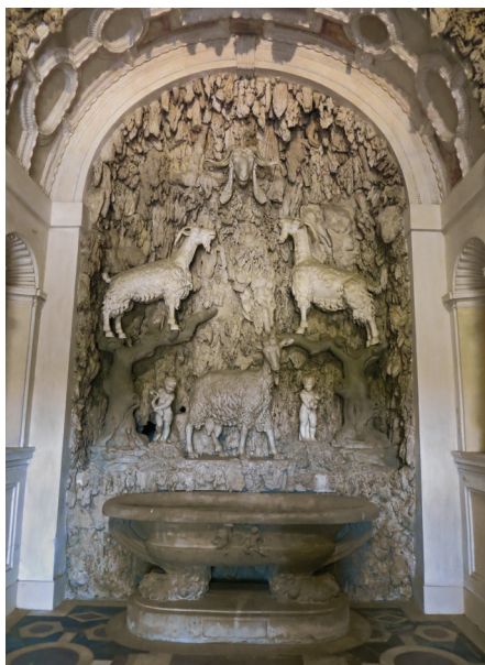
Fig. 2. Florence, jardin de Boboli, grotte dite de Madame.

Bien des siècles plus tard, le texte de Cicéron stimulera à nouveau l'imagination d'un autre artiste, Hubert Robert lorsqu'il sera chargé en 1785 de concevoir pour Marie-Antoinette, aux côtés de l'architecte et entrepreneur Jacques Jean Thévenin, la Laiterie de la reine à Rambouillet. Destinée à la dégustation de lait frais et de fromage, cette fabrique constitue un petit édifice isolé, auquel la façade à fronton confère l'auguste dignité d'un temple. Un vestibule circulaire, richement paré de marbre, donne accès à une longue salle voûtée, éclairée par une ouverture zénithale et creusée au fond d'une abside couverte de blocs appareillés et irrégulièrement taillés de manière à composer des rocs massifs (Fig. 3). Surgissant au sein de l'architecture, cette