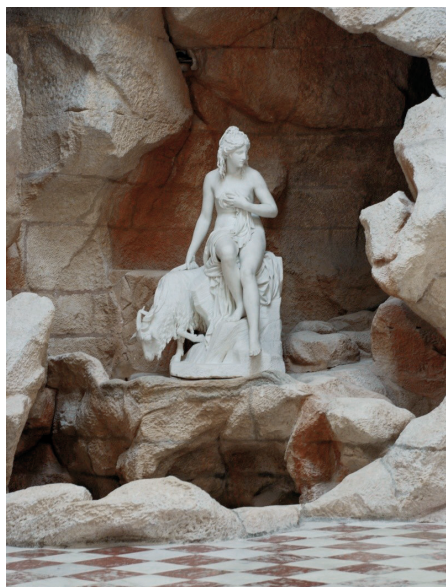
Fig. 3. Rambouillet, Laiterie de la reine.

La plupart des théoriciens de l'époque moderne adhèrent, avec plus ou moins d'insistance, à l'idée selon laquelle «les grottes sont faites pour représenter les antres sauvages», 17 comme le dit Jacques Boyceau de la Barauderie dans son traité, publié à titre posthume en 1638. Or, comme