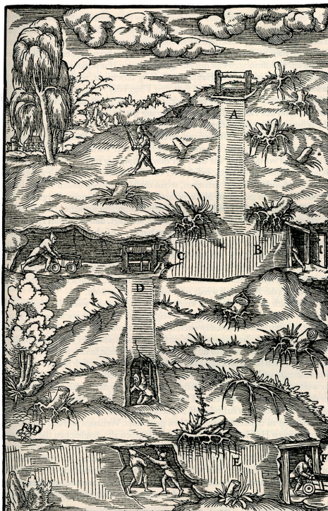
Fig. 5. Scène d'extraction minière, gravure sur bois tirée de Georgius Agricola, De re metallica , Bâle, Froben 1556.

L'évocation de cet univers des mines peut passer par le filtre mythologique grâce au thème des forges de Vulcain, cité par Caro et illustré notamment au XVIII e siècle dans les jardins du Quirinal à Rome, au sein d'une petite grotte adjacente à la fontaine de l'Orgue, au moyen d'un groupe de statues installé en 1778 – Vulcain, trois cyclopes et un putto actionnant un soufflet –, en provenance de la villa Cybo à Massa. 26 Mais au Siècle des lumières, tandis que l' Encyclopédie vulgarise les savoirs géologiques et fait écho au grand débat entre vulcanisme et neptunisme, la représentation du travail des mines tend à adopter un registre plus réaliste. C'est cette activité grouillante dans les tréfonds du sol, habituellement invisible aux regards, que met en scène au palais épiscopal de Kroměříž, aujourd'hui en République tchèque, une petite grotte datant du XVIII e siècle et décorant la sala terrena , une vaste salle ouverte sur le jardin (Fig. 6). On y observe des figurines polychromes, représentant des ouvriers transportés par de simples treuils, des chiens et un cheval, qui s'affairent dans une sorte de maquette de mine, dont les filons métalliques sont rendus par des lignes de couleur, évocation minutieuse – à la manière des automates des cabinets de curiosités – de l'exploitation du précieux minerai dans les conditions précaires de ce temps. 27