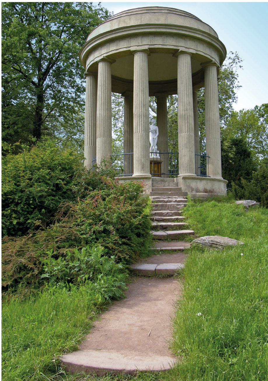
Fig. 10. Wörlitz, temple de Vénus.