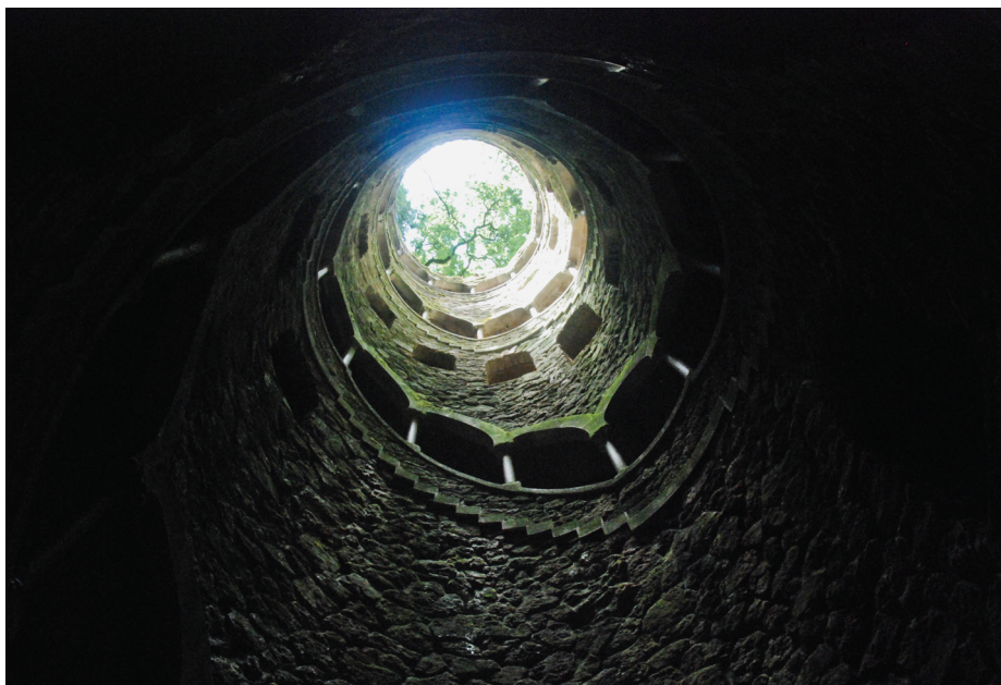
Fig. 11. Sintra, Quinta da Regaleira, Puits initiatique.

ro et Manini ont voulu orchestrer une symbolique dont le point d'orgue serait le Puits initiatique. En effet, on pénètre dans cette tour inversée, de vingt-huit mètres de hauteur, qui introduit dans les profondeurs de la terre par une énorme pierre tournant sur son axe. Puis on emprunte un escalier en spirale qui s'ouvre par des arcades sur le vide central et descend par des volées de quinze marches scandé par neuf paliers jusqu'au fond, où apparaît une croix des Templiers au centre d'une étoile à huit branches, emblème héraldique de Carvalho Monteiro. Cette descente pourrait évoquer les neuf cercles de l' Enfer dans La Divine Comédie de Dante. Après ce passage par le Puits initiatique, qui, soigneusement appareillé et orné de colonnettes et de chapiteaux, s'oppose au vertigineux Puits imparfait, inquiétant empilement de pierres brutes, le visiteur s'engage à tâtons dans une véritable traversée de la terre. Ayant perdu la notion du temps et de l'espace, il pourra, au terme du parcours, finalement déboucher vers la lumière, soit derrière le rideau d'eau de la cascade en surplomb du lac que franchit un gué artificiel, soit à l'arrière des deux monstres préhistoriques gardant l'hémicycle de la terrasse Céleste. Même si nous ne disposons pas actuellement de la documentation nécessaire pour affirmer l'appartenance de Carvalho Monteiro à un mouvement initiatique quelconque,