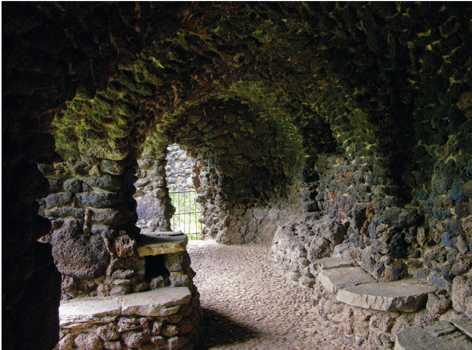
Fig. 9. Wörlitz, caverne des Ermites.

Deux chemins s'écartent l'un de l'autre. L'un, à droite, est pareil à l'ascension difficile et irréfléchie de l'homme sans connaissance et culture de l'esprit. [...]