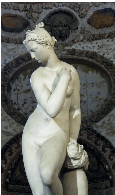
Fig. 8. GIAMBOLOGNA, Vénus , exécuté vers 1570, installé en 1592-1593, marbre, Florence, jardin de Boboli, Grande Grotte, troisième salle.

fait d'opter pour la vie contemplative, active ou bien voluptueuse, à la manière de Pâris devant juger entre Athéna, Héra ou bien Aphrodite. Frappant tout à tour aux portes latérales, Poliphile aperçoit d'abord une «dame de grand âge, ayant contenance de veuve» et demeurant «à l'entrée d'un chemin fort malaisé, raboteux et difficile à passer», puis une «matrone de regard furieux, tenant une épée fourbie», dont l'habitation semble «rude, et pleine de travaux». Enfin, la porte centrale découvre une belle jeune fille «pourvue d'un regard lascif et inconstant» et un lieu que le héros trouve «joli, gaillard et gracieux». Bien que ses conseillères l'avertissent qu'une telle beauté est «feinte, fausse et fardée», que «la volupté passe et la honte demeure, accompagnée de repentance», et que ne l'attendent que «vaine espérance et dommage très certain», 36 c'est bien sur le chemin de l'amour que le narrateur s'engage...