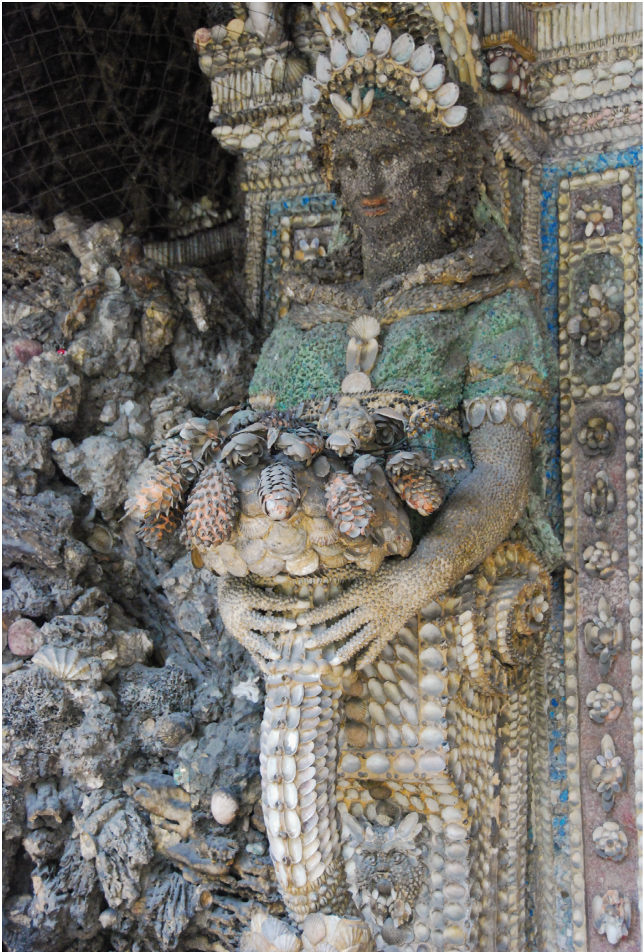
Fig. 1. Munich, Residenz, fontaine du Grottenhof.