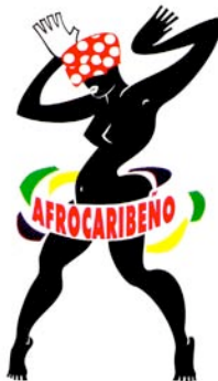
Figura 2 : Festival Afro-caribeño IVEC, 1997