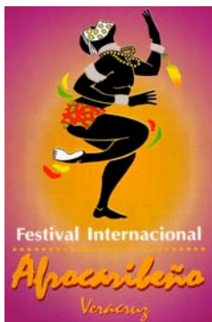
Figura 1 : Festival Afro-caribeño IVEC, 1996

El carácter artificial de este injerto entre reconocimiento de la Tercera Raíz y promoción de la cultura popular regional, entre “lo afro” y “lo caribeño”, es precisamente lo que explica el fracaso de esta política y la progresiva pérdida de credibilidad del Festival Internacional Afro-caribeño . Considerado por Conaculta como “una de las promesas ‘festivaleras’ del país” 19 , se transformó paulatinamente en un instrumento de marketing turístico, adoptando una visión sin complejo de la cultura como entretenimiento, pero también en una herramienta de marketing político, permitiendo atraer a los electores con estos grandes espectáculos de entretenimiento totalmente gratuitos, y haciendo del tema “Afro” un elemento de representación del Otro. Este aspecto se nota por ejemplo en el desfase entre los discursos del festival sobre los “aportes culturales” y la insistencia iconográfica sobre los rasgos fenotípicos y las posturas corporales que representan a una África muy estilizada y muy alejada de la idea misma de aporte de la “tercera raíz” a la cultura nacional y mestiza del México contemporáneo (figuras 1, 2 y 3).