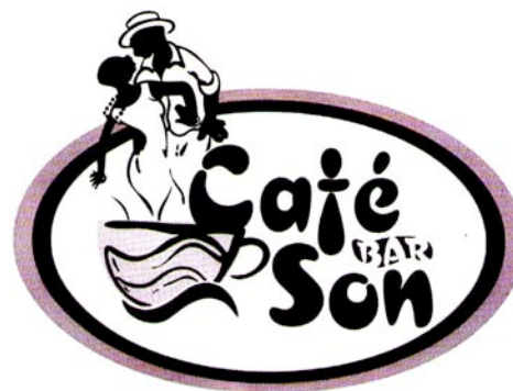
Figura 7 : Logotipo del Café del Son, Tarjeta de invitación,

IVEC, Rincón de la Trova, Noviembre de 1996