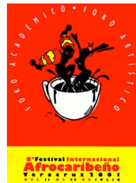
Figura 3 : Festival Afro-caribeño IVEC, 2001

Mediante este desplazamiento progresivo pero cada vez más notable en la política cultural local, el Caribe como telón de fondo y la legendaria alegría de la población de Veracruz permiten asentar la imagen de la ciudad de entretenimiento de las guías turísticas, que se constituye de este