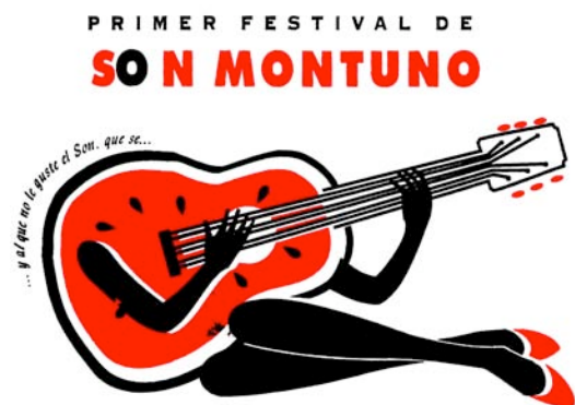
Figura 6 : Afiche del Primer Festival de Son Montuno

IVEC, Rincón de la Trova, Noviembre de 1996