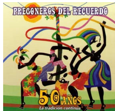
Figura 5 : Tapa del disco conmemorando el 50 aniversario del grupo Pregoneros del Recuerdo (Pentagrama, 2007)

Más aún, desde el lanzamiento del disco ¡Guarachero! 26 , muy ligado a la tradición afrocubana, el líder de Juventud Sonera cuida su imagen de rockstar, al mismo tiempo que expresa públicamente su interés para el son. Se dejó crecer el cabello y escogió tocar con una guitarra eléctrica negra de una prestigiosa marca norteamericana y, como su público se lo dice, se parece cada vez más a Jimi Hendrix o Lenny Kravitz, multiplicando así las referencias a la cultura negra.