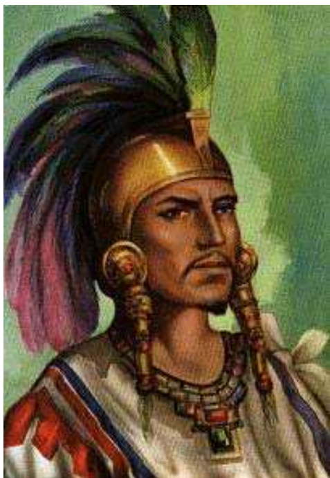
Cuauhtémoc: ejemplo de la representación del indígena histórico

Ahora bien, en el área de interés de este manuscrito, ¿cómo podemos articular la discusión anterior con la construcción de sentidos sobre el ser indígena, codificados textual e icónicamente? Flores (Flores 2007) hace una revisión de lo que podríamos considerar los primeros códigos que dan sentido a la producción de imágenes como forma de conocimiento sobre poblaciones “nativas”. Estudia el conocimiento generado desde la antropología británica y su rol en la creación de imaginarios visuales a propósito de las regiones y sujetos colonizados (ibid: 66). También revisa el código de los imaginarios poscoloniales latinoamericanos donde los indígenas aparecen vinculados a ideologías de construcción de lo