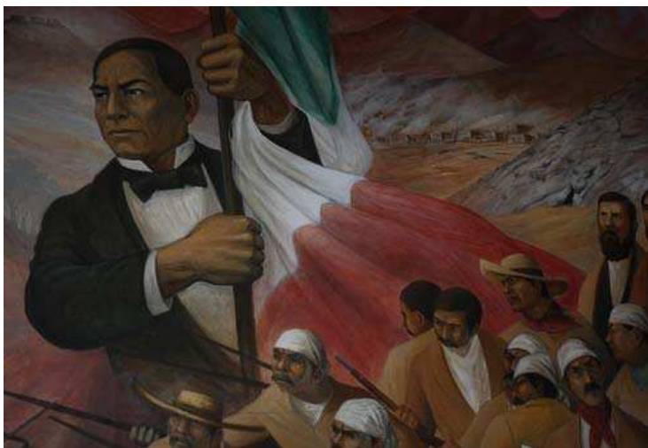
Benito Juárez: ejemplo de la representación del indígena defensor de la soberanía nacional: ganó contra el intento de invasión de los franceses.

Ahora bien, en el área de interés de este manuscrito, ¿cómo podemos articular la discusión anterior con la construcción de sentidos sobre el ser indígena, codificados textual e icónicamente? Flores (Flores 2007) hace una revisión de lo que podríamos considerar los primeros códigos que dan sentido a la producción de imágenes como forma de conocimiento sobre poblaciones “nativas”. Estudia el conocimiento generado desde la antropología británica y su rol en la creación de imaginarios visuales a propósito de las regiones y sujetos colonizados (ibid: 66). También revisa el código de los imaginarios poscoloniales latinoamericanos donde los indígenas aparecen vinculados a ideologías de construcción de lo