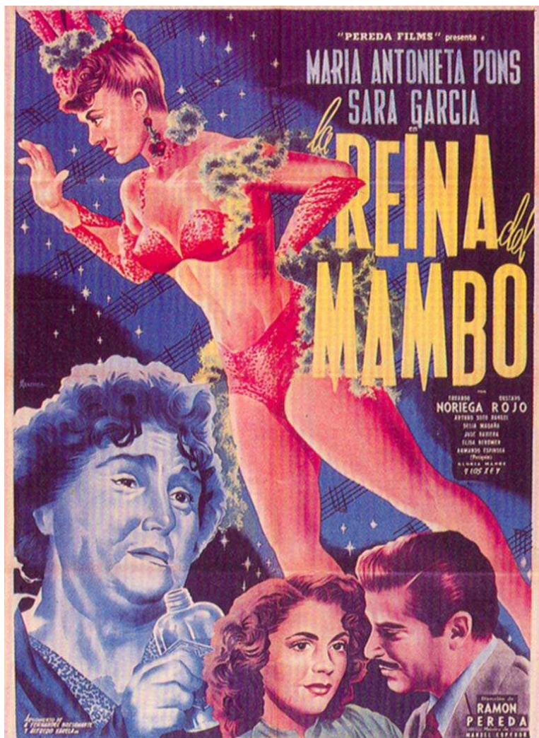
La reina del trópico (Raúl de Anda, 1945)

narran el mestizaje mulato: el estereotipo ya formado. Unas en la apariencia fabricada de la mujer blanca cuyo cuerpo, comportamiento y vestido hablan más que el tono de piel, 18 otras que en el tono de piel llevan el estigma o la fortuna de representar su origen antillano.