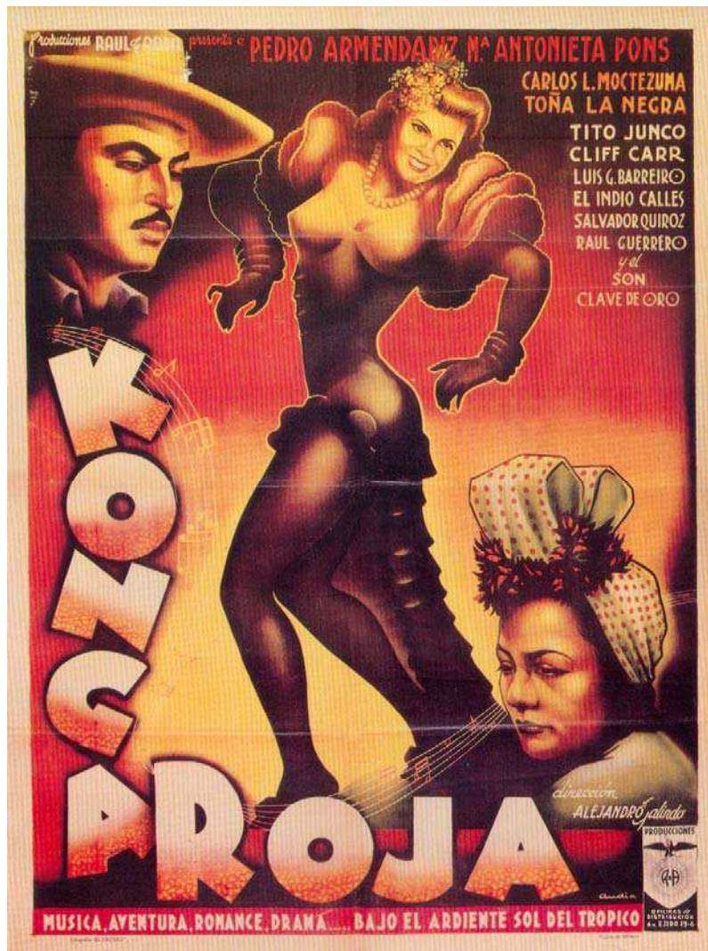
Konga Roja (Alejandro Galindo, 1953).

El cine mexicano de los años 1930 a 1950, acogió a las mulatas y a los negros como personajes que adquirieron una considerable popularidad. Se aprecia su tránsito por los escenarios cinematográficos en argumentos, canciones, ritmos, hasta en la creación del conocido “cine de las rumberas.” Este último dio cabida a ambos tipos populares. Tras este fenómeno de asimilación cultural, la industria cinematográfica en México se desbordó en la construcción de personajes con los que se aludió al trópico y que si bien describieron aspectos del mestizaje, no dejan de ser, a ojos del espectador, referencias a “lo ajeno”.