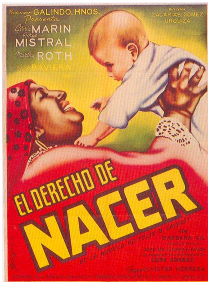
Derecho de nacer (Zacarias Gómez, 1951)

representativos de la vida social insular. Ya en la radio, en programas como El derecho de nacer y La tremenda corte , estos mismos personajes harán lo propio en otro soporte. Aunque en términos de diseño del personaje resultan parecidos y en algunos casos hasta idénticos.