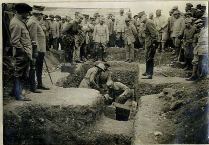
Fig. 2 et 3. -Ouverture de la tombe A en présence du Général Sarrail (22 Mai 1917).

La richesse archéologique de ces régions ne suffit pas à elle seule à expliquer cette stratégie culturelle. Celle-ci s'inscrit en réalité dans une continuité politique, la Méditerranée orientale étant devenue une zone d'influence scientifique depuis la seconde moitié du XIX e siècle, après la création de l'École française d'Athènes en 1846, très vite imitée par d'autres nations européennes et les États-Unis. Dans ce contexte de rivalités internationales où domine la « science allemande », le terrain archéologique ne s'est pas limité à la Grèce, mais s'est élargi vers l'Orient et la Mésopotamie, dans le cadre du Great Game . Ainsi la construction, voulue par Guillaume II, du chemin de fer entre Berlin et Bagdad, le Bagdadbahn , qui joue un rôle logistique important dans le conflit mondial, a-t-elle favorisé les fouilles de Baalbek à partir de 1898. C'est pourquoi la guerre ne marque pas l'arrêt total de l'archéologie, qui sert aussi bien la propagande et les renseignements allemands – dans le cadre de