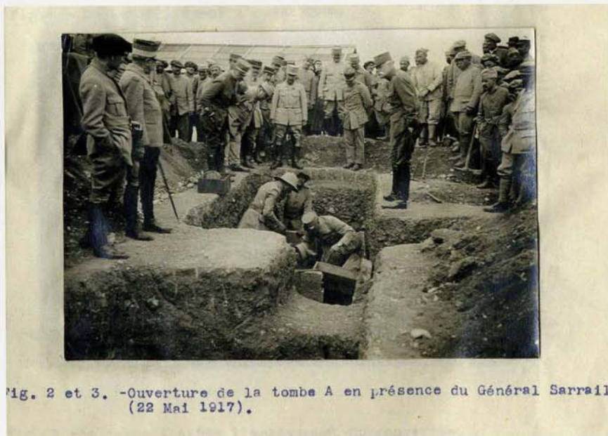
Fig. 2 et 3. -Ouverture de la tombe A en présence du Général Sarrail (22 Mai 1917).

La richesse archéologique de ces régions ne suffit pas à elle seule à expliquer cette stratégie culturelle. Celle-ci s'inscrit en réalité dans une continuité politique, la Méditerranée orientale étant devenue une zone d'influence scientifique depuis la seconde moitié du XIX e siècle, après la création de l'École française d'Athènes en 1846, très vite imitée par d'autres nations européennes et les États-Unis. Dans ce contexte de rivalités internationales où domine la « science allemande », le terrain archéologique ne s'est pas limité à la Grèce, mais s'est élargi vers l'Orient et la Mésopotamie, dans le cadre du Great Game . Ainsi la construction, voulue par Guillaume II, du chemin de fer entre Berlin et Bagdad, le Bagdadbahn , qui joue un rôle logistique important dans le conflit mondial, a-t-elle favorisé les fouilles de Baalbek à partir de 1898. C'est pourquoi la guerre ne marque pas l'arrêt total de l'archéologie, qui sert aussi bien la propagande et les renseignements allemands – dans le cadre de