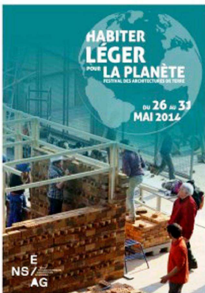
Fig. 1 : Affiche du séminaire.