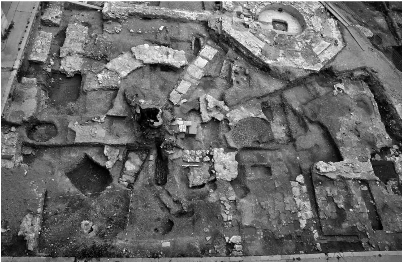
Figure 5 : Véritable palimpseste archéologique, les chercheurs sont parvenus à localiser et à détecter des traces de l'ancienne abbatale Saint-Sauveur dans le sol d'un lieu qui fut occupé pendant près de treize siècles