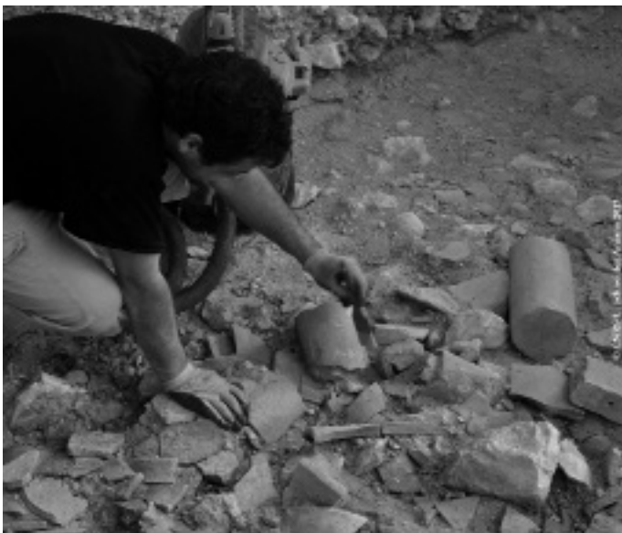
Fig.6b : Fouille en cours (2013) de la galerie nord du cloître médiéval détruit pendant les guerres de religion.