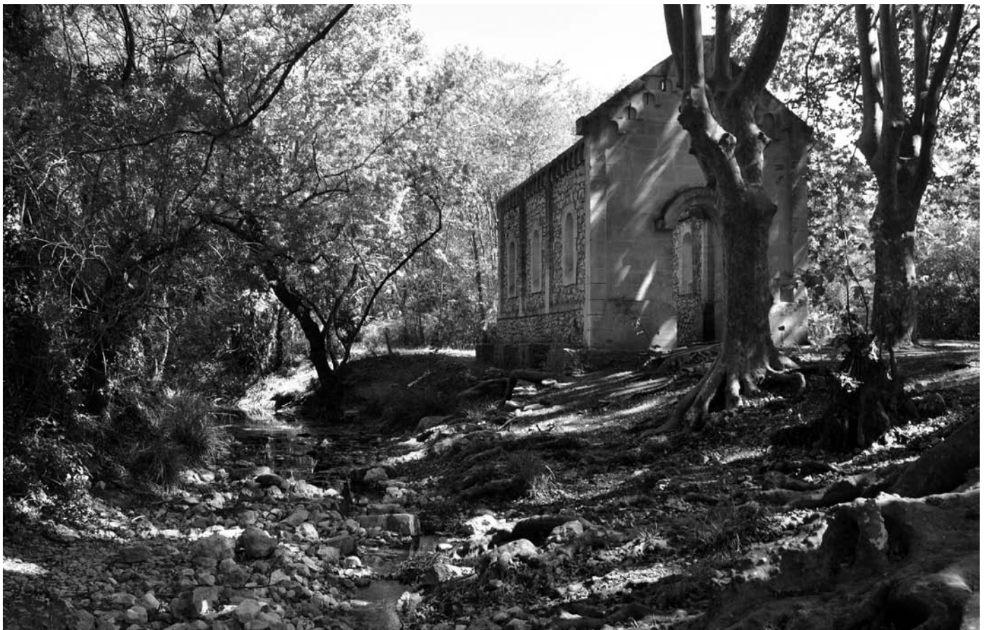
Figure 1 : Les sources de Saint-Laurent et de Saint-Rome à Aniane sur les rives du «Corbière» sont associées par la tradition au lieu de l'ermitage primitif où vint s'établir Witiza avant qu'il ne renonce à la formule érémitique du monachisme et ne fonde un premier monastère dédié à la Vierge puis au Christ.

Lorsque Benoît s'établit à Aniane dans les dernières décennies du VIII e siècle, les règles, coutumes