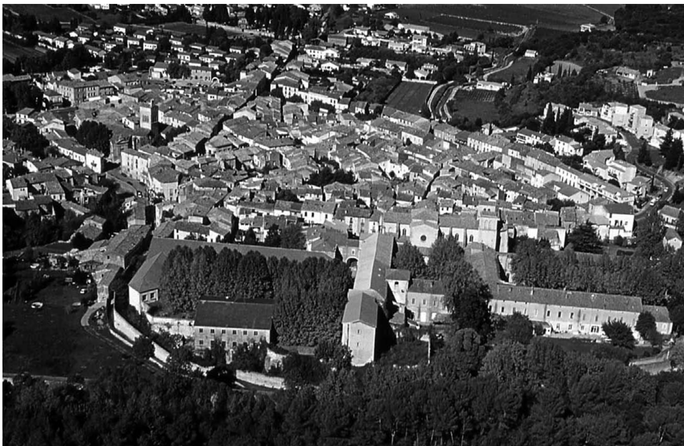
Figure 2 : Witiza devenu «Benoît» édifié vers 782 à quelques centaines de mètres de son ermitage primitif, un véritable monastère, en un nouveau lieu qui connut de nombreuses métamorphoses treize siècles durant. Au XII e s. un bourg fortifié s'est formé aux abords du monastère Saint-Sauveur donnant naissance au village actuel (Cliché L. Schneider, 2014).

et observances monastiques sont loin d'être uniformes d'un établissement à l'autre dans tout l'Occident.