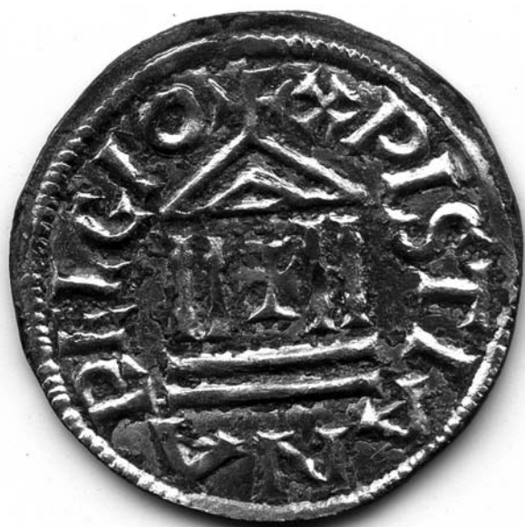
Figure 3 : Denier au temple et à légende chrétienne (822-840) de l'empereur Louis le Pieux découvert à Aniane lors des fouilles de 2012.

Benoît d'Aniane composa alors la Concordia regularum , compilation dans laquelle chaque passage de la règle de Benoît de Nursie est éclairée par les passages concordants des règles de Basile, Pacôme et de Colomban. Ce travail de réception des anciennes règles monastiques constitue une source primordiale pour l'histoire du monachisme occidental entre le V e et le IX e siècle.