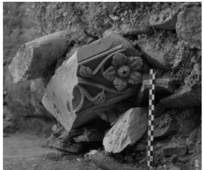
Fig.6c : Fragment de tailloir du cloître roman découvert lors des fouilles de 2013.