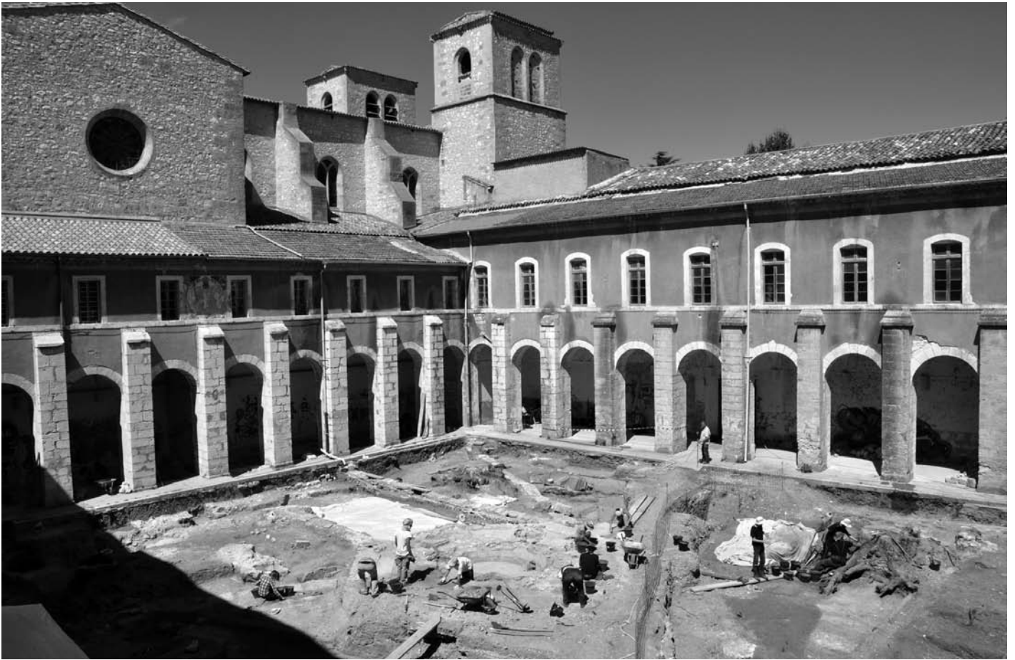
Figure 4 : L'abbaye carolingienne et médiévale d'Aniane a été entièrement reconstruite par la congrégation de Saint-Maur à la fin du XVII e et au début du XVIII e s. Depuis 2011 un programme de fouilles archéologiques tente de retrouver les traces des premières constructions