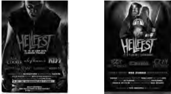
Les affiches 2010 et 2011 du festival Hellfest

Les références aux films d'horreur et à la mort sont explicites : "Le heavy metal s'attache dès le début des années 1970 à une iconographie heroic fantasy tirée du cinéma et de la bande dessinée. Ce qui va contribuer à accentuer sa dimension ésotérique, à souligner ses aspects virils et guerriers."