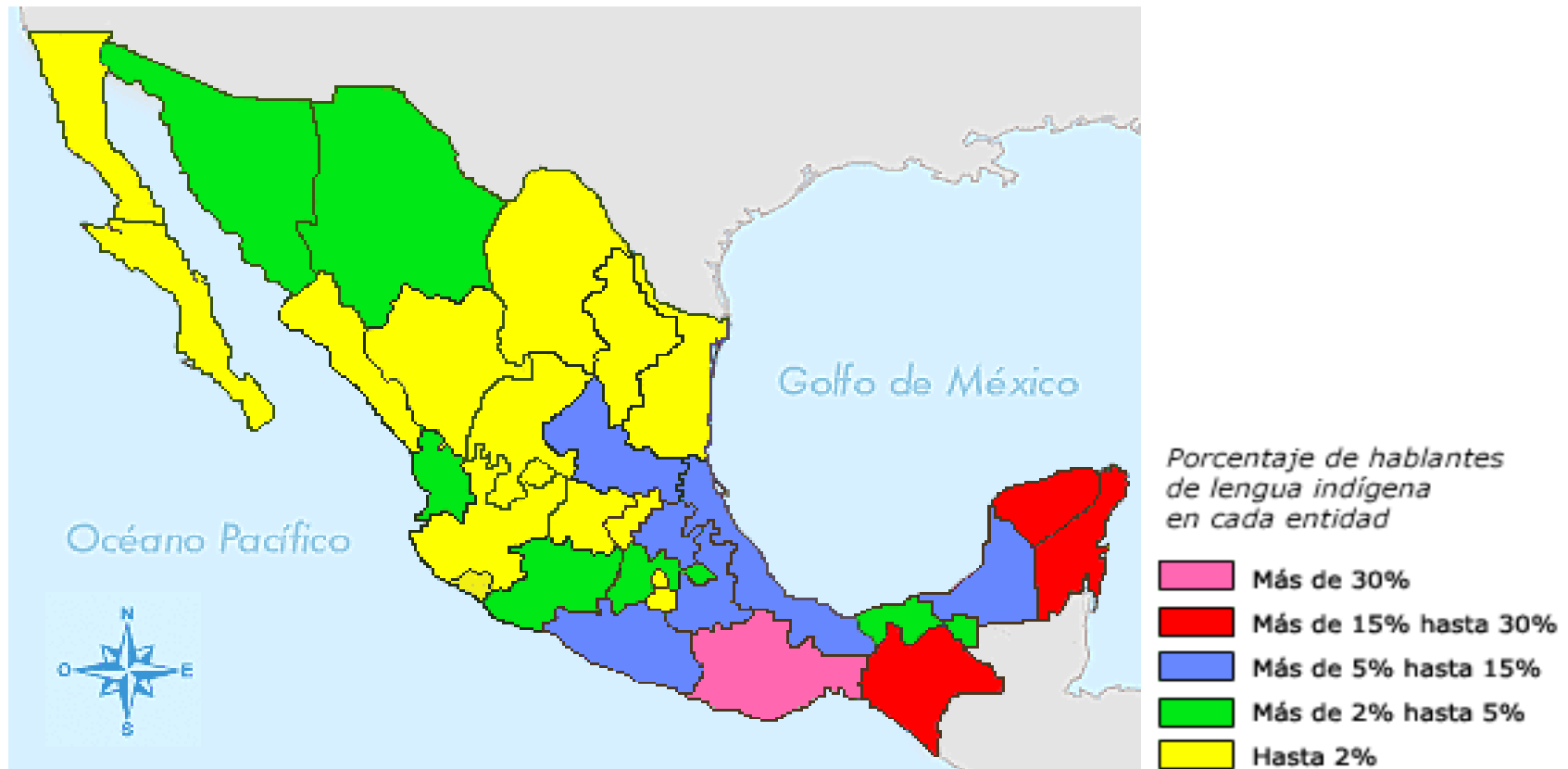
Mapa 2. Diversidad lingüística en México: presencia desigual

( http://cuentame.inegi.gob.mx/impresion/poblacion/lindigena.asp ) [última consulta, 14.01.2014]