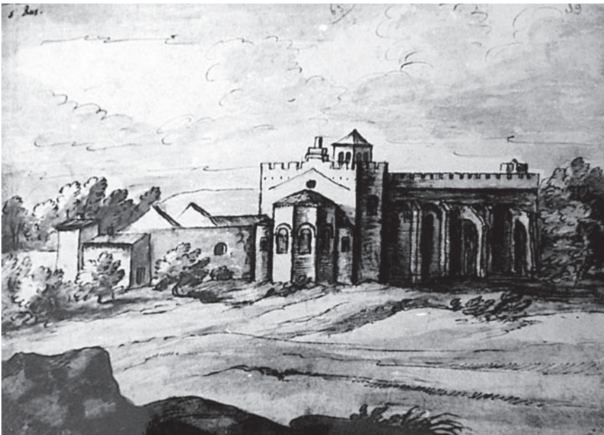
Fig. 3 – Vue de l'église du nord-est avant la suppression de la nef en 1763. Dessin de l'album de la collection de Laincel. Musée Calvet, Estampes, fol. 36 (fol. 81, p. 63, dessin n° 39).

D'autres transformations remontaient à l'époque monastique : au mur occidental du bras nord il subsistait une large porte rectangulaire datable du XVII e siècle, encastrée dans le parement roman et ouverte jusqu'au mur