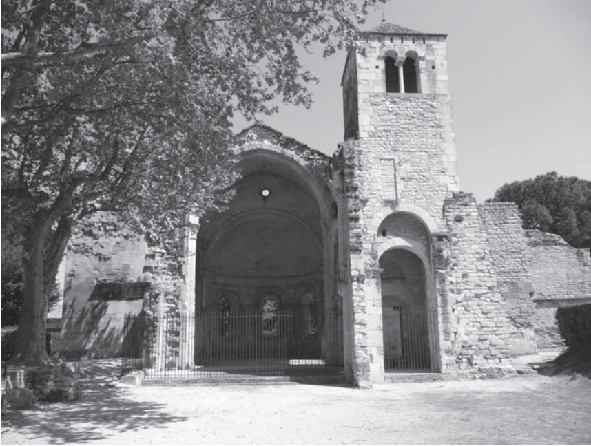
Fig. 1 – Vue de l'église vers l'est.

le rang qui revenait au site éponyme sur le plan historique. Les raisons concrètes du remplacement complet de l'église précédente restent inconnues, tout autant que la forme et l'envergure de cette dernière, à défaut de fouilles archéologiques. Or, l'ordonnance architecturale de l'édifice d'époque romane tardive révèle une particularité affirmée qui pose la question de la fonction liturgique des espaces, et celle des antécédents de leur disposition.