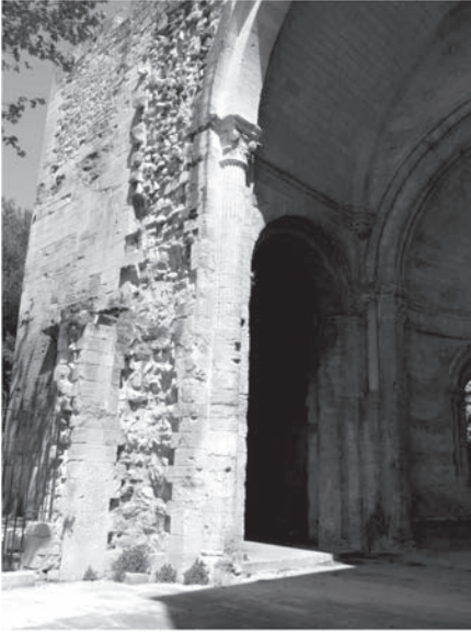
Fig. 5 – Arrachement du mur gouttereau nord de la nef et bras nord du transept (cl. A. Hartmann-Virnich).

consécutive la prit pour argent comptant 30 , est un exemple éloquent de la différence qui pouvait exister entre l'état réel des édifices et la vision de l'architecte, dont le témoignage est donc d'autant plus périlleux qu'il est aujourd'hui difficile d'en vérifier les fondements matériels.