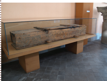
Photographie du cercueil dans la salle d'exposition du musée Bargoin (Clermont-Ferrand)