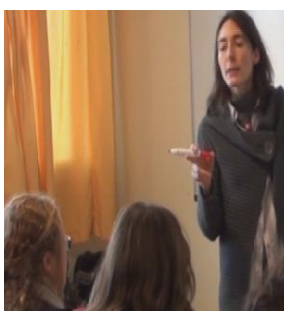
Figure 1 : geste déictique pointé vers l'élève évalué

A une très large majorité, dans les deux contextes, nous observons des déictiques orientés vers l'élève évalué (fig.1), à l'exception de 8 pointages (sur 68) comptabilisés en FLS en direction du tableau ou d'une fiche de travail supports d'évaluation. Bien que ce chiffre soit peu important, nous pouvons supposer que cette action enseignante permet à l'EANA d'intégrer l'idée qu'en France les supports de savoir peuvent être multiples : camarades, enseignant, tableau et autres supports didactiques 4 .