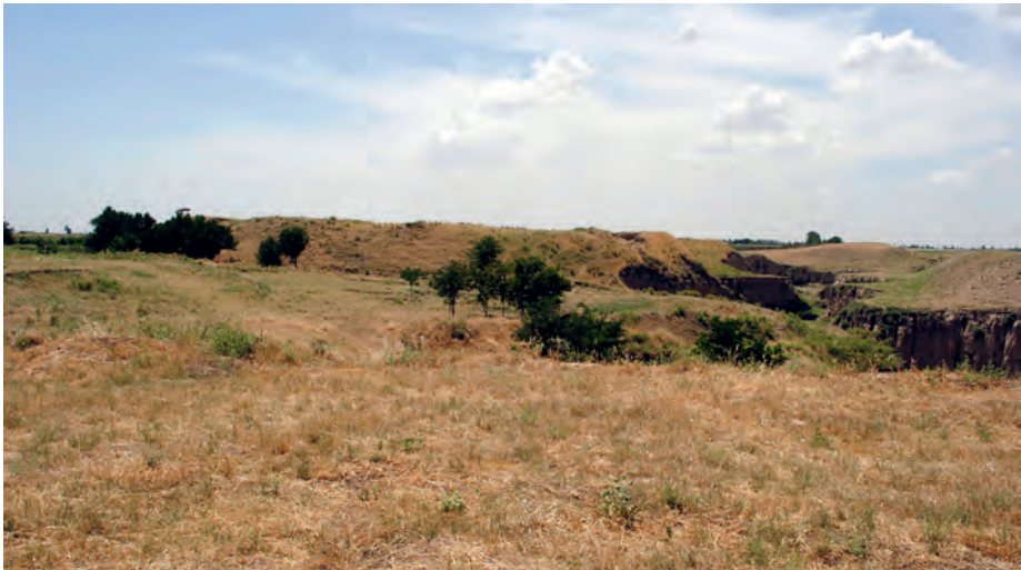
Figure 1 – Padayatak tépé. A. Vue du côté nord-ouest du site montrant l'érosion et l'épaisseur des couches archéologiques; B. Vue du côté sud du site.