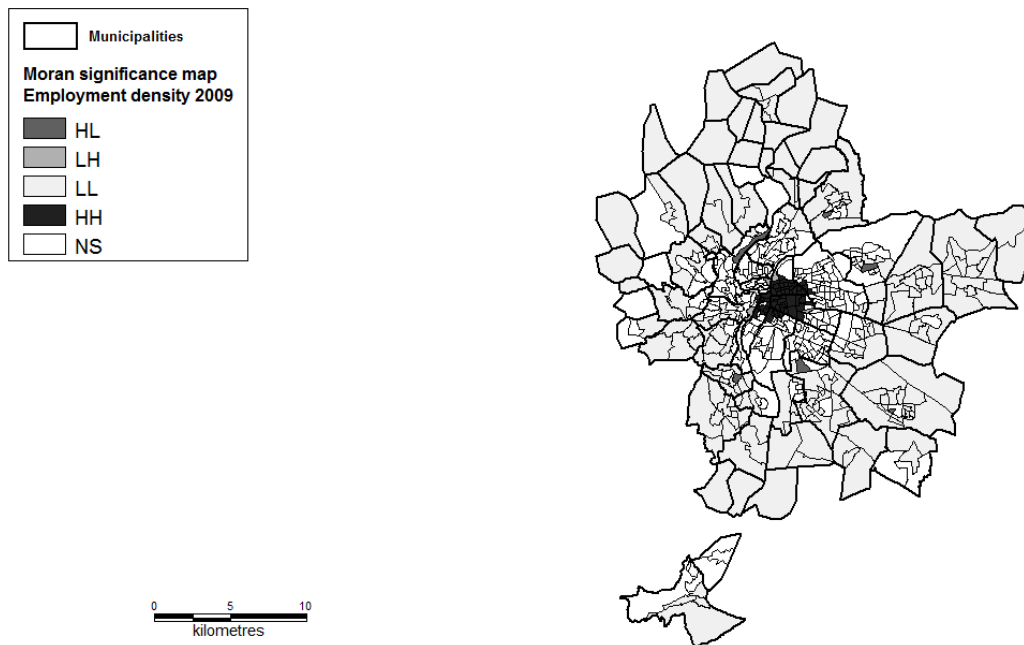
Carte 1: Carte de significativité de Moran concernant la densité d'emploi en 2009 (matrice de contiguïté à l'ordre 2)

La Carte 1, représentant les associations spatiale au niveau local, révèle la présence d'un centre d'emploi principal dans le centre-ville Lyonnais, où les quartiers ont une densité d'emploi élevée et sont entourés de quartiers aux densités d'emploi également élevées (configurations Haut-Haut dans le graphique de Moran). On identifie également cinq centres d'emploi secondaires potentiels, caractérisés par des densités d'emploi