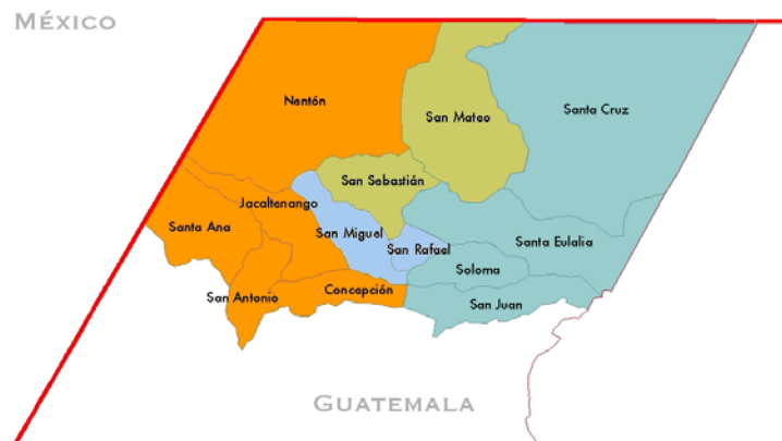
Le continuum dialectal q'anjob'alien

akatek – sont des « langues proches ». Les langues q'anjob'aliennes ont été parmi les plus étudiées des langues mayas et sont dotées de solides monographies (cf. Zavala 1992 pour l'akatek, Craig 1977 pour le popotí, OKMA 2000a et 2000b). La question de leur continuité/diversité a fait l'objet d'un célèbre article de Terrence Kaufman (1976), avec son plaisant et retentissant « une langue ou quatre langues, mais ni deux ni trois », qui a eu des conséquences sur l'élaboration de la carte officielle des langues mayas du Guatemala dans les années 1990 (tant pour le q'anjob'al que pour les langues quichéanes), à la suite d'un précédent tout aussi retentissant pour la diversité du domaine maméan (cf. Kaufman 1969). Cette contribution a permis de voir que le continuum dialectal q'anjob'alien, qu'on peut considérer comme un carrefour typologique des langues mayas, s'avère un observatoire heuristique pour une synergie entre dialectologie et typologie linguistique, notamment phonologique (cf. Léonard & dell'Aquila 2009).