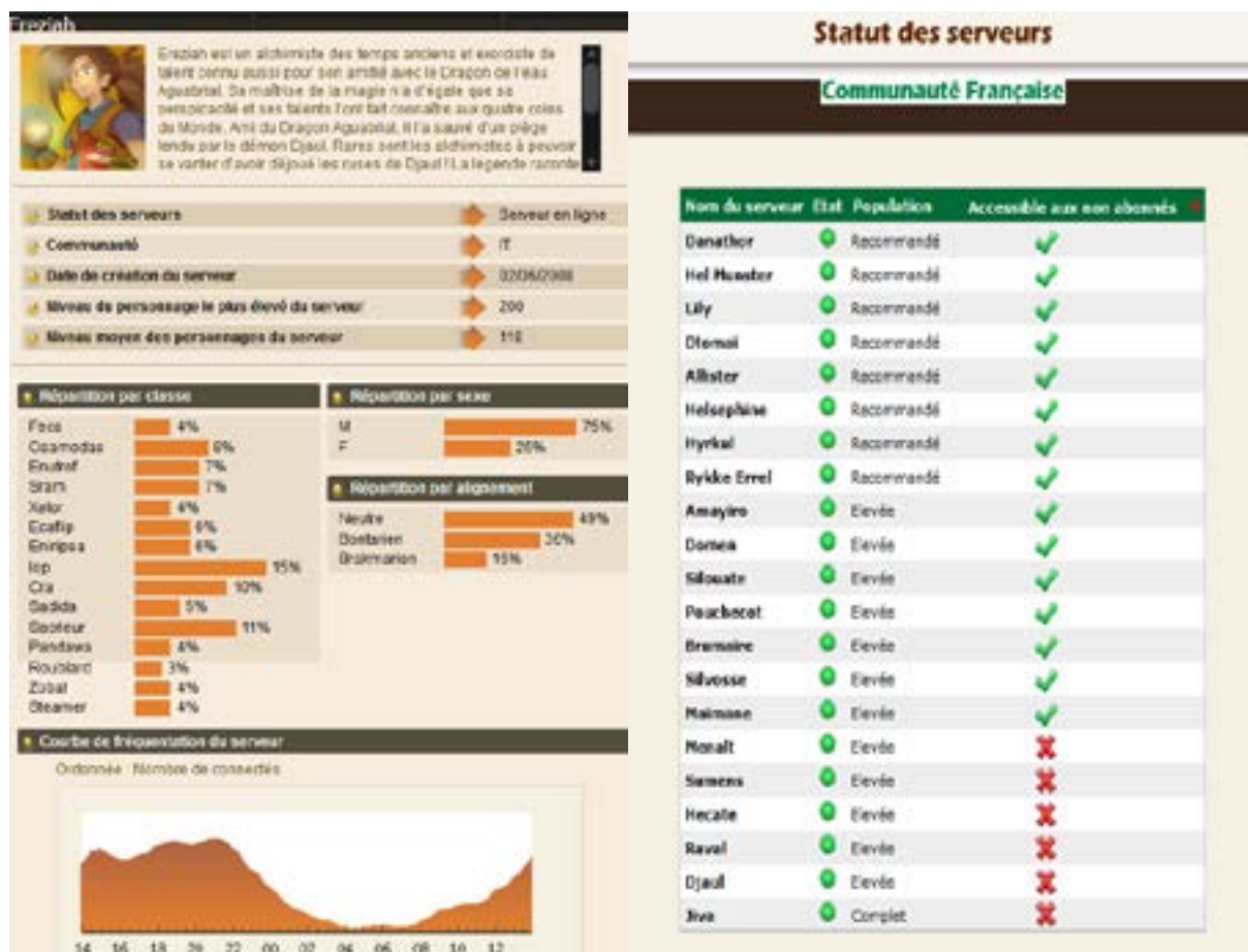
FIGURE 2 : À GAUCHE, LES DONNÉES D'UN DES 50 SERVEURS DU JEU DOFUS (SEPTEMBRE 2008). À DROITE, LE STATUT DES SERVEURS (SEPTEMBRE 2008)

Certains joueurs prennent toutefois appui sur des données quantitatives aux valeurs absolues, dont le contrôle semble à première vue avoir été négligé par l'entreprise. Pour y parvenir, plusieurs contributeurs des deux forums ont eu l'idée de s'intéresser à un classement des personnages de Dofus en fonction de leur nombre de « points d'expérience ». Nommé « Ladder Dofus 2.0 », ce classement est disponible publiquement sur le site internet de Dofus. Les joueurs qui discutent sur les deux forums sont certains que tous les personnages des « serveurs de jeu » dont le « niveau d'expérience » est « supérieur à 20 » y sont listés. En revanche, un grand nombre de subtilités du « Ladder » restent l'objet de spéculations et de débats au sein de ces communautés de critiques.