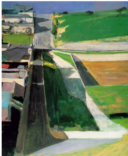
Richard Diebenkorn Cityscape I 1963

Le scepticisme qui émane de cette dernière citation m'incite, en guise de conclusion, à suggérer un point de passage entre modes de représentation, en portant l'écriture de Boyle du côté des toiles de Richard Diebenkorn ou de Wayne Thiebaud. Je songe en particulier aux paysages urbains représentés par ces deux artistes californiens : aplats de couleurs contrastées suggérant des collines parcourues de vertigineuses rues à la verticale, ou encore trajectoires parallèles grises et froides de "freeways" dont aucun hors-champ ne permettra jamais la rencontre. Ces images ne manquent pas de faire naître chez celui qui les découvre dans les pages d'un livre d'art ou dans les salles du MoMA de San Francisco un sentiment d'inquiétante étrangeté qui ouvre un suspens permettant à la question « pourquoi vivons-nous ici ? » de filtrer dans sa conscience.