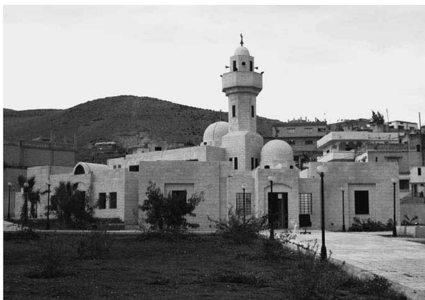
Figure 3. Mausolée d'Amir b. Abi Waqqas en 2004