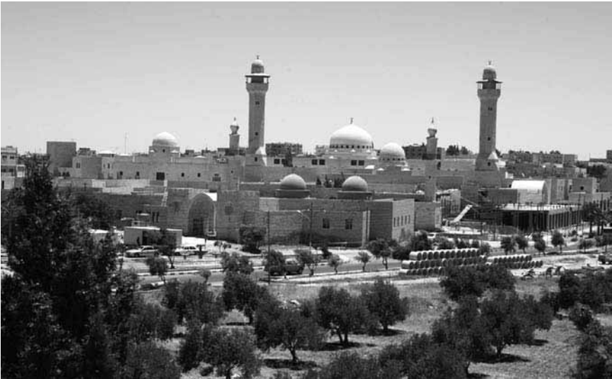
Figure 5. Mausolées dédiés aux commandants de la bataille de Mu'ta, en 2001

introduire de nouvelles formes d'art et d'architecture islamiques. Celles-ci se traduiraient par la modernisation de certaines traditions artistiques. Le développement d'un style architectural propre à la monarchie est lié à l'affirmation de l'identité politique et culturelle hachémite. Il se veut représentatif des conceptions