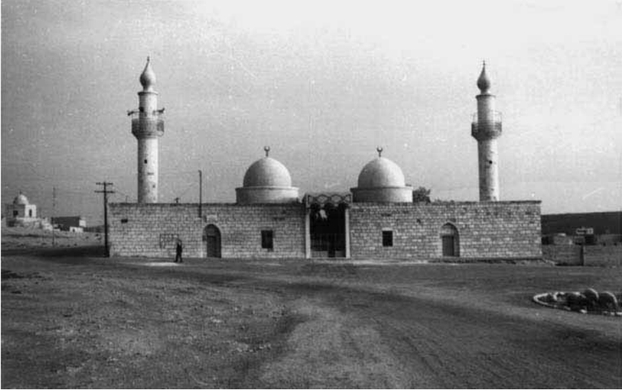
Figure 4. Mausolée de Ja'far b. Abi Talib dans les années soixante