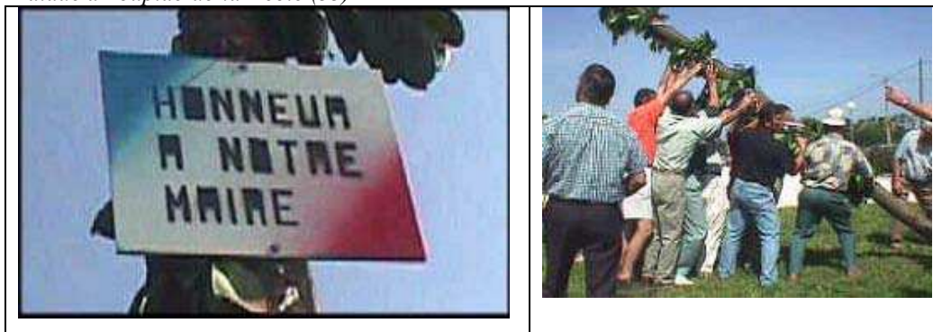
Fig. 1 : Maïade à Loupiac-de-la-Réole (33)