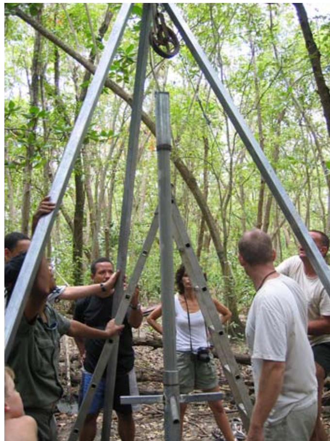
Figure 3 : Extraction du prélèvement du carottier.