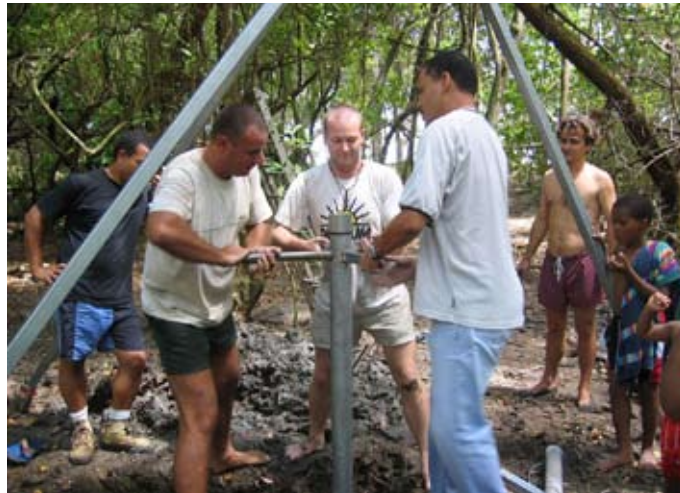
Figure 2 : Réalisation d'un prélèvement sédimentaire dans la mangrove relictuelle de la plage de Dizac.