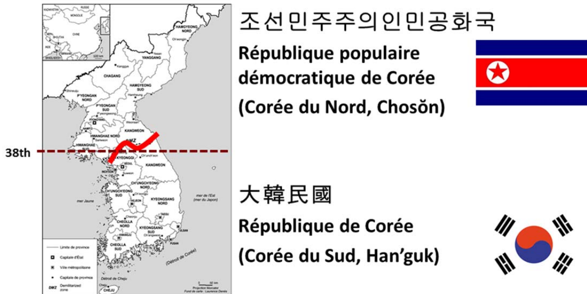
Figure 1: La Corée divisée

On le sait, la péninsule coréenne est un pays politiquement divisé en deux États depuis 1948 (voir figure 1 : La Corée divisée) : au Nord, la République Populaire Démocratique de Corée, ou Chosŏn minjujuŭi inmin konghwaguk ; au Sud, la République de Corée ou Taehan min'guk . La Corée du Nord ( Chosŏn ) s'oppose à la Corée du Sud ( Han'guk ), sachant que ces deux pays ont une présence au monde, et notamment au monde occidental, pratiquement antithétique. La Corée du Sud est aujourd'hui devenue un pays développé (symbole de ce que l'on a appelé un « miracle économique »), elle s'est démocratisée, et envahit désormais l'Asie et le monde occidentale par ses produits culturels (musique pop, cinéma, séries télévisées), ce qui n'est sans doute pas étranger au grand succès que connaît le coréen dans les universités françaises. La Corée du Nord est quant à elle un pays totalitaire confronté à une crise extrêmement grave de l'ensemble de son système qui se veut socialiste et qui est pour l'Occident, une forme « d'antimonde » – pour reprendre les mots du géographe Roger Brunet.