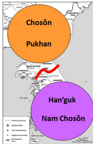
Figure 3: Quatre Corées au moins!

조선, 북조선, 남조선: Chosŏn (du Nord) et Chosŏn du Sud 조선학 / 남조선연구원: études du Chosŏn / études du Chosŏn (du) Sud