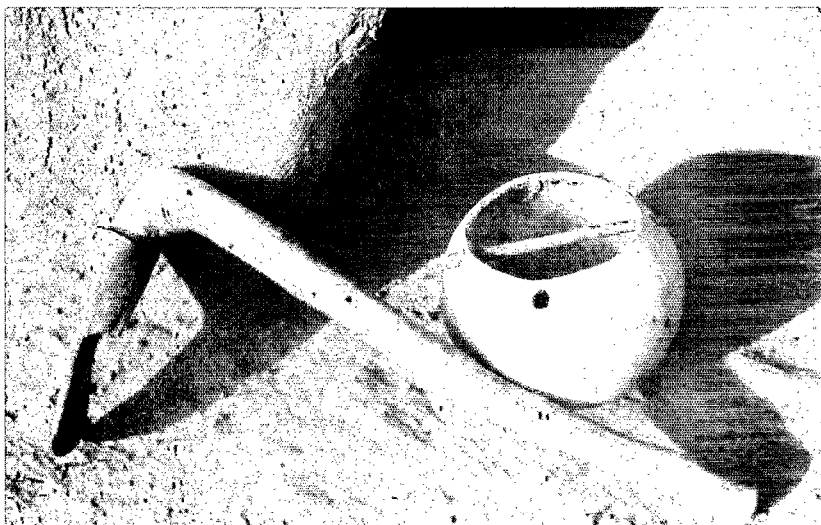
PHOTO 1. — Saxaade (houe à semer) et Ippa-n-rolle (calebasse contenant les graines)