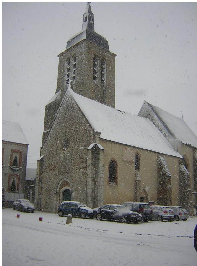
Eglise de Montigny-Lencoup (77)