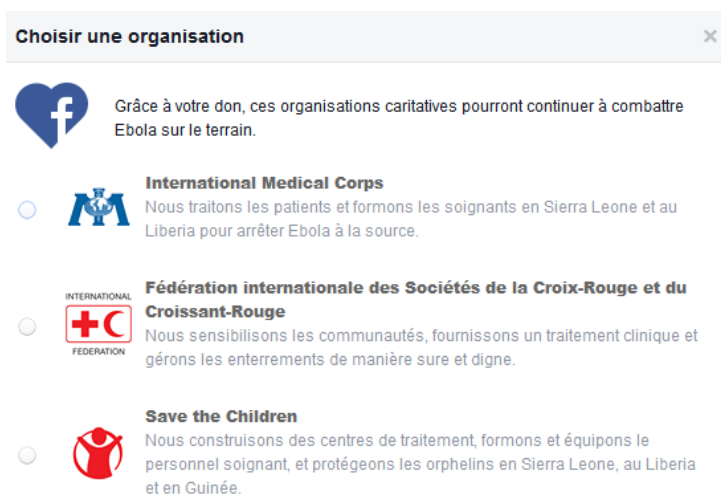
Figure 2 – Appel aux dons de Facebook

Autre triste actualité... Le 4 novembre 2014, Facebook lance un appel aux dons pour lutter contre Ébola.