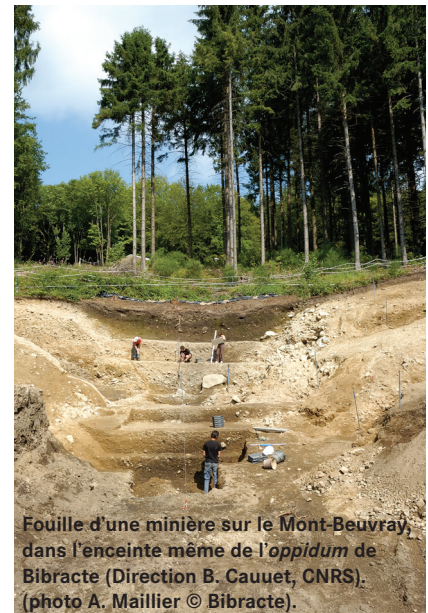
Fouille d'une minière sur le Mont-Beuvray, dans l'enceinte même de l'oppidum de Bibracte (Direction B. Cauuet, CNRS). (photo A. Maillier © Bibracte).

Trois carottes prélevées dans le massif du Morvan ont fait l'objet de ce protocole d'analyse. La première située au Port-des-Lamberts, sur la commune de Glux-en-Glenne (Nièvre), a été choisie parce qu'elle se situe à proximité du site de Bibracte, à environ 5 km à vol d'oiseau. La deuxième tourbière est localisée dans le même secteur géographique du Haut-Morvan, sur le massif du Grand-Montarnu, à quelques kilomètres seulement de celle du Port-des-Lamberts. La tourbière du Grand-Montarnu présente la particularité de s'inscrire dans un secteur très riche minéralogiquement, dans un lieu où des vestiges d'activités minières sont encore visibles. En l'absence de fouilles, la chronologie des exploitations antérieures au XIX e siècle reste aujourd'hui