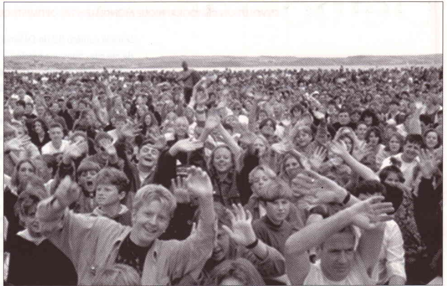
Le nombre des hommes a toujours une forte signification.

Un problème semblable survint avec la guerre du Vietnam. Les accords de Genève de 1954 prévoyaient des élections