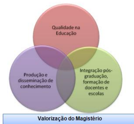
Figure 3. [1] DEB - Relatório Final de Gestão 2009-2011_31 jan 2012.

Le PIBID a été créé avec les objectifs suivants: