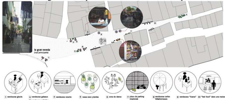
Activités informelles dans la rue principale du barrio La Cruz.

Nous avons successivement développé une autre activité, celle de cartographier les activités informelles qui se trouvaient à la Gran Vereda les samedis. Nous avons identifié chaque vendeur informel et chaque kiosque. Là encore nous avons travaillé avec les enfants que, cette fois, ont été plus nombreux. Nous avons tracé des chemins avec des fils colorés qui débouchaient sur les petites places qui se forment à l'intersection des ruelles. Il leur a été demandé de dessiner au sol avec des craies de couleurs les espaces identifiés : places parking des motos, les bouches d'égout ou simplement d'écrire leurs envies pour le barrio .