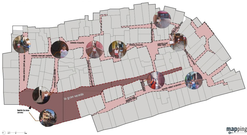
Carte des rues du barrio La Cruz. Réalisée par l'auteure. Source des données : cartographie collective.

La première exploration a permis la réalisation d'une esquisse du barrio qu'est devenue notre document de base. Nous voulions construire une carte qui montre tout autant les dynamiques spatiales du bidonville comme les sensibilités de leurs réalisateurs. Nous n'avions pas pour objectif de compter les maisons ou d'analyser les typologies, mais de montrer comment les espaces collectifs sont utilisés, en particulier le long de la rue principale. Le recours au GPS nous a aidé à cartographier notre parcours, au sein d'une application muette. Ce quartier a une identité spatiale forte en ce qu'il se ramifie en 13 ruelles se retournant sur eux-mêmes.