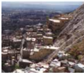
Damascus - Qasrout