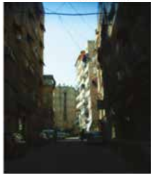
Damascus - Mizzeli #1