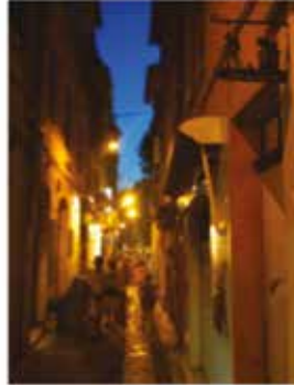
Antibes, Côte d'Azur - France