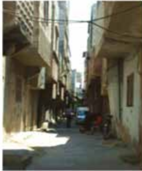
Damascus - Sbeinah