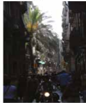
Barcelona, Barceloneta - Spain

Une morphologie et des tissus urbains de quartiers informels de Damas comparables à ceux d'espaces urbains méditerranéens remarquables d'échelles variées.