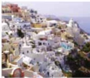
Santorini - Grèce