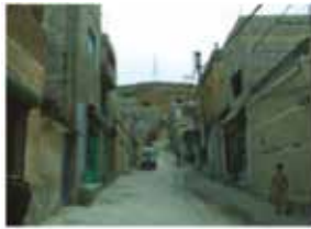
Damascus - Boustan Al-Rai