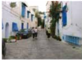
Tunis, Sidi Bou Said - Tunisie