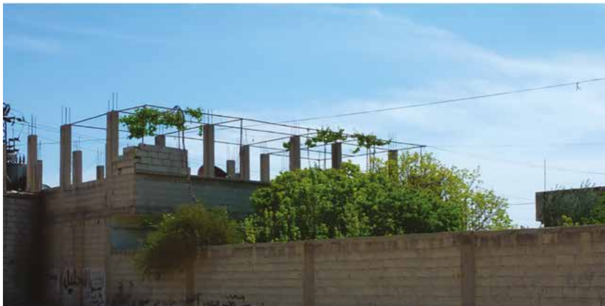
Les habitants verdissent des toitures (vigne), quartier informel de Bahdaliéh, Damas.

L'adaptation au changement climatique dans ces quartiers peut également tirer parti des aspects positifs du réchauffement en diminuant les dépenses. Par exemple, l'augmentation des jours ensoleillés rend plus efficace et rentable la mise en place de panneaux solaires et surtout de chauffe-eaux solaires.