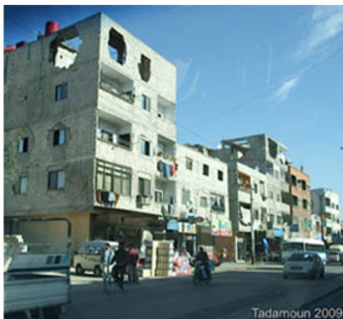
Quartiers informels de Boustan al-Riz et Tadamoun à Damas

Enfin, cette tendance a été confirmée depuis le début de la « crise syrienne » en mars 2011, point de départ d'une nouvelle vague de construction dans ces quartiers, comme dans d'autres pays arabes actuellement en « transition » (CLERC 2012). Les habitants ont mis à profit l'actuelle situation de relâchement administratif sur ce point précis pour construire de nouvelles bâtisses et surélévations d'immeubles. Aucune étude ne permet encore d'en chiffrer l'ampleur, confirmée par les habitants et constructeurs de ces quartiers, mais le phénomène en 2011 aura sans doute été d'autant plus important que l'immobilier joue un rôle de valeur refuge en période d'instabilité et que la construction avait été ralentie dans certaines régions informelles depuis la mise en application de la loi 59 de 2008.