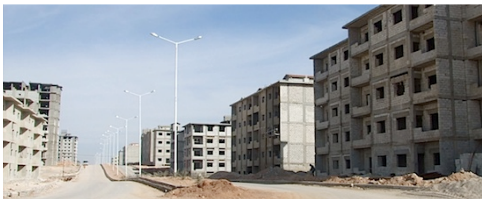
Logement vides à Artouz et logements publics en construction à Dahyah Qudsaya Sakanya al-Jadida (région de Damas).

Un grand nombre de ces logements formels sont cependant restés vides ou inachevés. Largement destinés à une clientèle haute gamme, ils sont principalement conçus comme des investissements à long terme, surtout par des ménages regroupés en coopératives et par des promoteurs nationaux ou internationaux. Ils ne répondent pas à la demande principale, celle des ménages à faibles revenus. Le créneau des logements de moyenne gamme, désormais accessibles avec des crédits, commence également à être investi par des promoteurs qui construisent en périphérie de la ville (Artouz, Kokab) ; mais ces derniers ne sont pas abordables par les ménages à faibles revenus ou aux revenus irréguliers. De plus, souvent ces opérations ne sont pas encore desservies par les infrastructures de base, et les logements, eux aussi achetés comme des investissements, ne sont généralement pas occupés. Enfin, la réalisation des logements publics qui vise les ménages à faibles revenus n'avance pas au même rythme que la construction privée formelle. Sur plus de 57 000 logements planifiés autour de Damas depuis 2000, seuls un peu plus de 3000 étaient terminés en 2009 et 16 000 étaient en travaux. Les lois et les politiques les plus récentes ont cherché à limiter la croissance du nombre de ces logements vides et inachevés (loi 82/2010) et à accélérer la production de logements sociaux (implication du secteur privé, logement publics locatifs), mais la tendance n'était pas infléchie fin 2010.