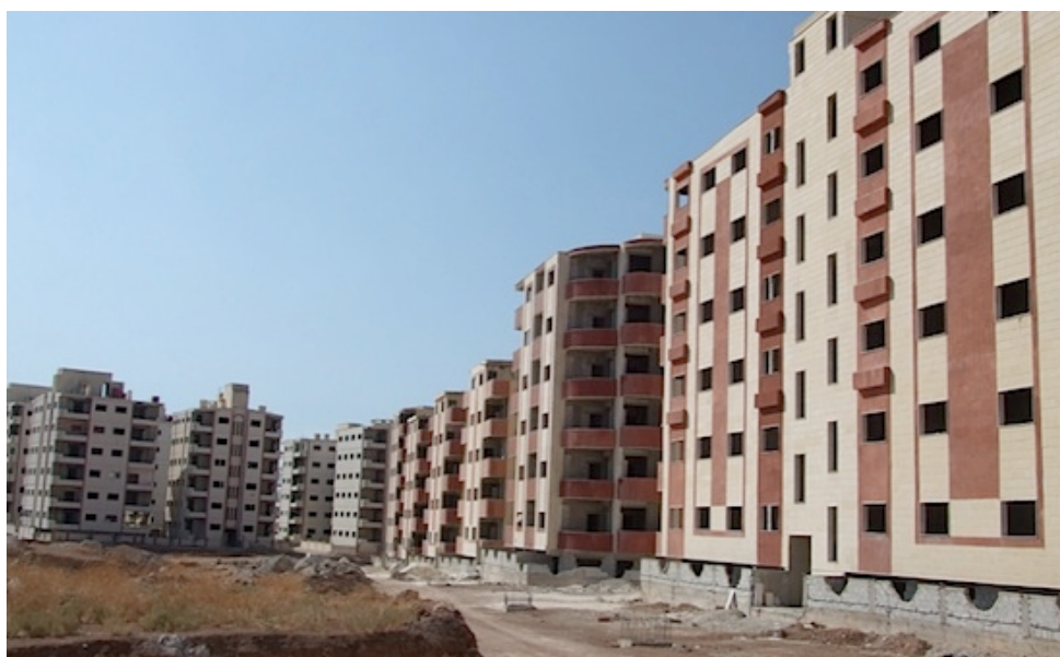
Logement vides à Artouz et logements publics en construction à Dahyah Qudsaya Sakanya al-Jadida (région de Damas). Photo V. Clerc, 2009