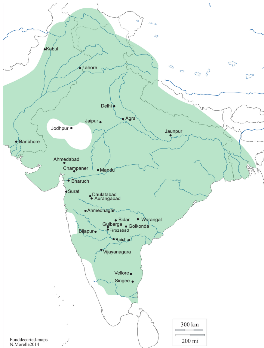
5- carte de l'expansion de l'Islam en Inde en 1351 (conquêtes du sultan de Delhi, Muhammad bin Tughluq).