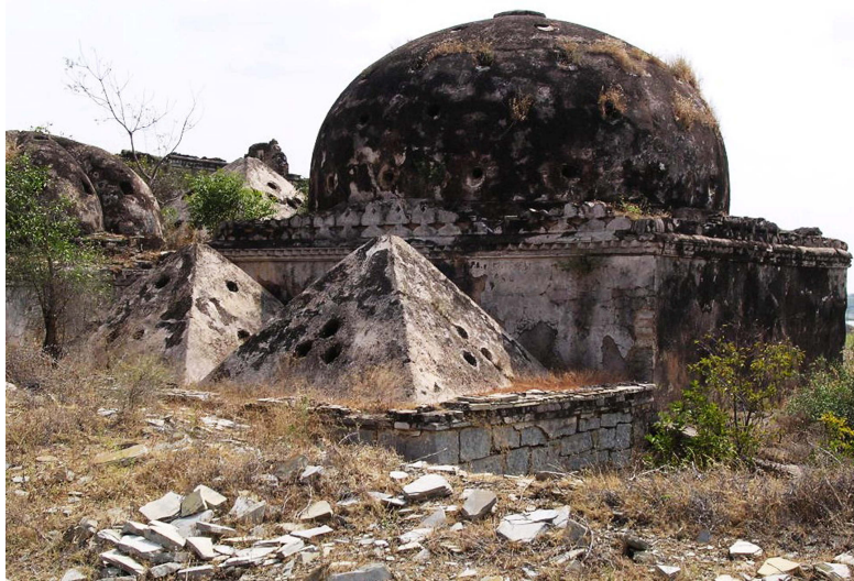
9 – Ce bâtiment de Firozabad est un des premiers hammams construits dans le Deccan vers 1400, et montre clairement un emprunt à l'architecture ottomane 6 .

en terme d'espace sacré dans l'espace urbain. Le centre du pouvoir, le palais, est souvent associé au fort et parfois au dargah (grande salle d'audience), celle du Kalifat al-Rahman à Firuzabad (1400) se trouve à l'extérieur de la ville, proche de la route principale. L'architecture palatiale cristallise les idées et la représentation du pouvoir politique qui se situent dans une continuité et une reprise du modèle Tughluq du Nord de l'Inde (Bidar, Sagar, Firozabad, puis Bijapur, Golkonde ou Ahmednagar). Avec l'enrichissement des sultanats au XVIème siècle, les structures palatiales deviennent plus imposantes et chaque cour développe un style particulier, comme les dômes sur les pavillons du Gumbad Darwaza sur le palais en trois parties de Bidar. Les palais comportaient des parties résidentielles privées et des espaces cérémoniels publics.