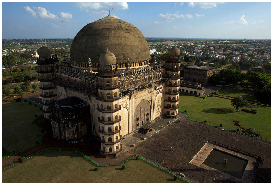
10- Le Gol Gumbaz (dôme rond en persan) à Bijapur est une des réalisations majeures de l'architecture indo-musulmane du Deccan. Le mausolée est réalisé en 1656 par Yaqut de Dabul pour Muhammad Adil Shah. Le dôme de 44 mètres de diamètre repose sur 8 arcs sur un plan carré et en fait une des plus grandes coupoles au monde. Sur chaque angle du monument se trouve une tour avec un escalier interne qui fait également office de contreforts.