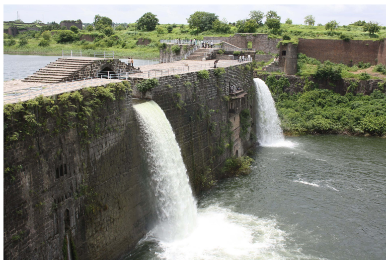
11- Le barrage du fort de Naldurg est un puissant ouvrage en pierre et mortier hydraulique de 144 mètre de long pour 15 de large témoignant du génie des constructeurs des sultanats du Deccan et des emprunts à l'ingénierie iranienne 7 . Terminé en 1613 pour Ibrahim Adil Shahi II, c'est un des premiers barrages voûtes qui résiste à la poussée de l'eau en prenant appui sur les versants de la vallée. L'écluse permettait une sélection et un calcul de la quantité d'eau écoulee pour garder le lac de retenue à une hauteur constante permettant également de protéger la base des murailles du fort. A l'intérieur du barrage il y a un pani mahal (palais de l'eau) avec une pièce de vie, des jeux d'eau et un balcon surplombant la vallée.