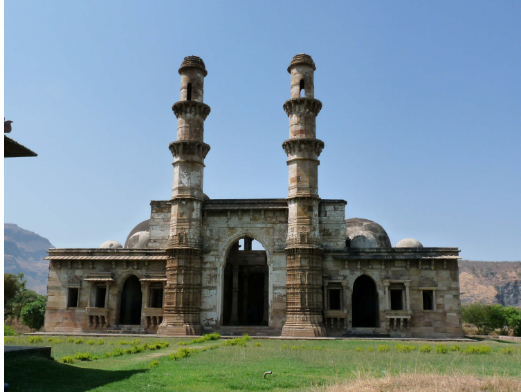
6- La Nagina Masjid de Champaner, construite à la fin du XV ème siècle 4 est entourée d'un jardin verdoyant alimenté par un système d'irrigation.