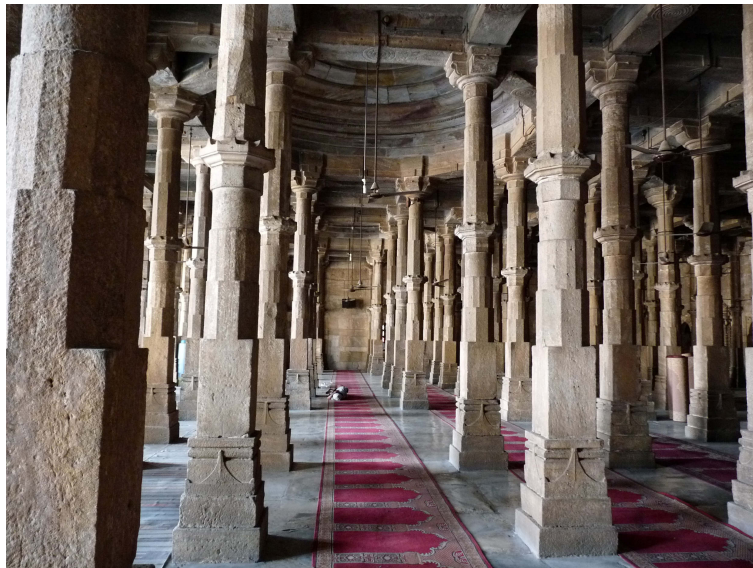
7- Jami Masjid d'Ahmedabad construite en 1424 au cours du règne d'Ahmed Shah. C'est probablement une des plus grandes mosquées indiennes avec sa vaste cour de 75m de long pour 66m de large, bordée d'une colonnade sur 3 côtés. Le bassin à ablutions se trouve au centre de la cour. Il y a trois entrées et le hall de prière occupe la partie Est. La salle de prière est couverte de quatre coupes. Les 260 piliers qui portent les coupes ont été récupérés sur un temple hindou.