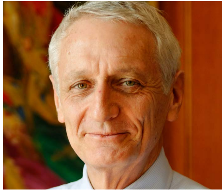
Nicolas Grimal Postface