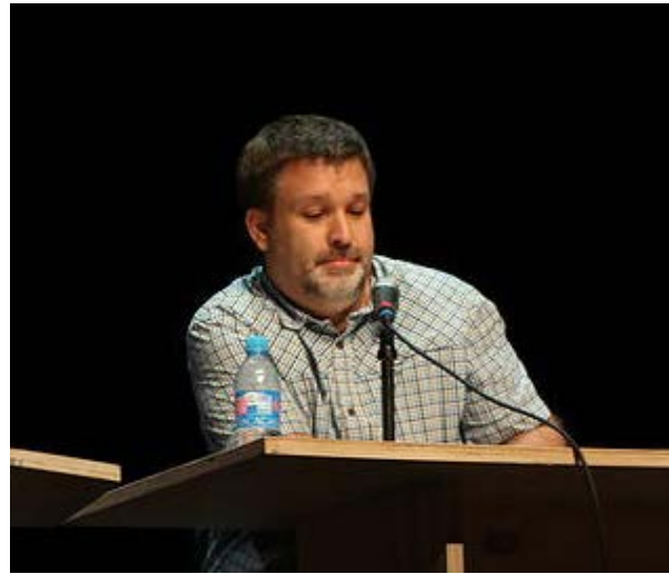
Stéphane François Un mythe contemporain : les Illuminati