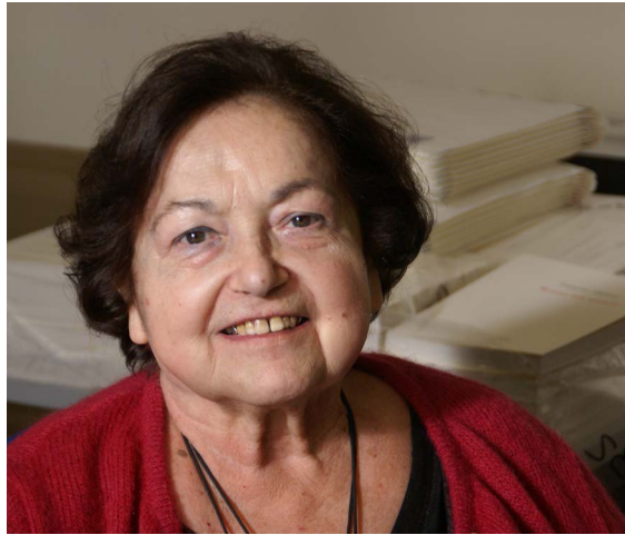
Françoise Héritier Le goût des autres