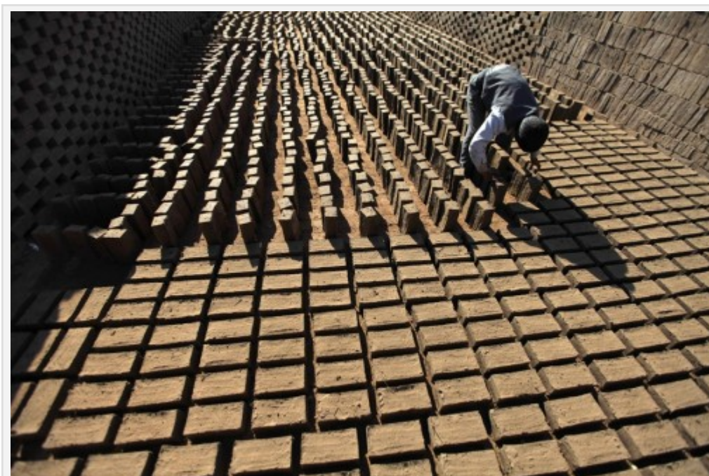
Fig. 1 : Séchage des briques

La brique est créée à partir d'une terre plastique avec une teneur en eau de 15-30 % ( Pour en savoir plus sur les cinq états hydriques de la terre ). On la fait alors sécher et elle est mise en œuvre par la suite à l'état sec. En fouille, l'identification de cette technique ne pose pas de problèmes particuliers (fig. 2). La distinction entre briques moulées et briques modelées peut cependant se révéler délicate. Les briques moulées présentent généralement des arêtes plus marquées et des surfaces bien parallèles (Sauvage 1998 : 23).