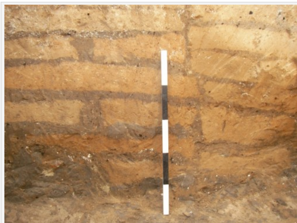
Fig. 2 : Çatal Höyük : mur en briques