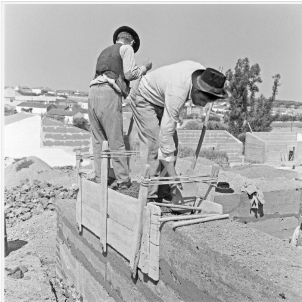
Fig. 8 : Construction d'un mur en pisé à l'aide de banches en bois (Ferreira do Alentejo, Alfundão, 1955, http://www.oapix.org.pt/100000/1/163,01,7/index.htm )

des perches, des traverses (les clefs et des cordes) » (Aurenche 1977 (2004) : 30-31) (fig. 8). Ce coffrage fait office de moule dans lequel la terre est coulée, puis tassée/compactée énergiquement soit avec les pieds soit à l'aide d'un outil (appelé pisoir ou pisou). La fonction du damage est naturellement d'améliorer la densité du matériau. Chaque banchée crée un « bloc » - un pan de mur épais - en terre massive. Le mur est décoffré immédiatement après que la terre a été damnée. Le coffrage est ensuite déplacé horizontalement. Il faut prendre garde de décaler les banches pour éviter de superposer les joints verticaux, points faibles du mur.