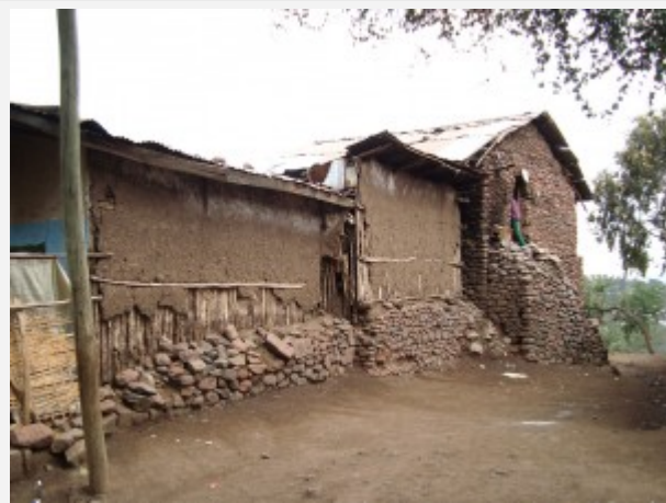
Fig. 3 : Éthiopie, maison construite en torchis. Les murs sont composés d'une ossature en bois couverte d'un épais enduit de terre