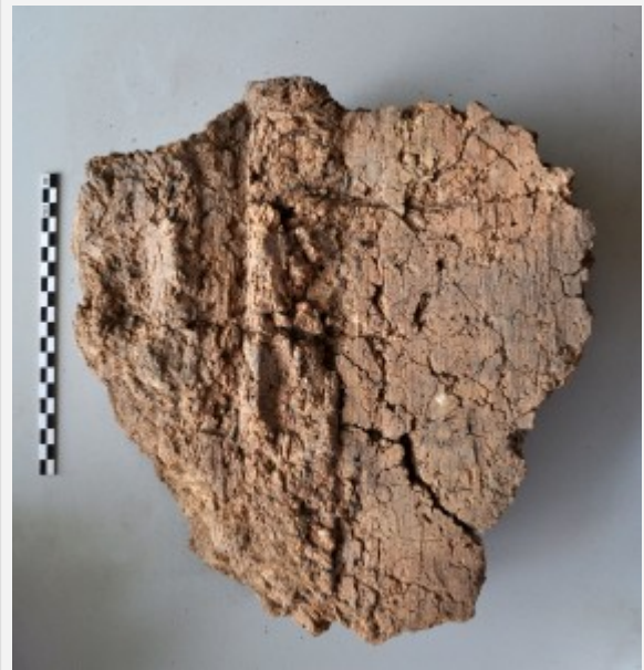
Fig. 4 : Fragment de terre à bâtir avec empreintes d'éléments végétaux.