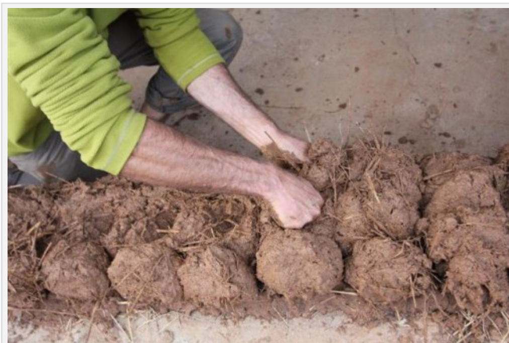
Fig. 5 : Construction d'un mur en bauge

La technique de la bauge consiste à empiler directement des boules/mottes/boudins /pains de terre à l'état plastique, en levées successives (fig. 5).