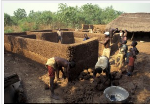
Fig. 6 : Construction d'une maison en bauge au Bénin

l'édifice (fig. 6). Cette technique ne nécessite aucun outillage technique. Durant le séchage, la face du mur peut être taillée à l'aide d'un outil tranchant (un paroir) pour donner un aspect plus homogène et plus soigné à l'ensemble (fig.7). Les murs obtenus sont en terre massive, monolithiques et souvent épais. La terre à bâtir, généralement mélangée avec des dégraissants végétaux, est mise en œuvre à l'état plastique (teneur en eau : 15-30%).