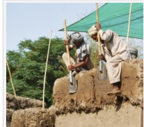
Fig. 7 : Utilisation de paroirs ( http://www.foundation.org/Article/locally-manufactured-bamboo-school-building )

Au cours de la fouille, cette technique peut être identifiée par les limites des mottes, si le mur est assez grossier, ou par les traces que le paroir aura laissées.