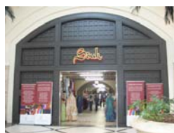
Figure 6. Le Souk à l'intérieur de Vangate Mall