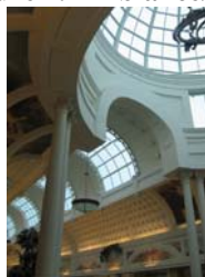
Figure 4. Ambiances architecturales à l'intérieur de Canal Walk (Century City)

Cette volonté de copier la ville, de faire émerger un morceau de ville qui serait de plus en plus autonome, où la population pourrait ne vivre que là, sans aucun autre besoin d'aller ailleurs, trouvant là tous les avantages de la ville sans les contraintes de pollution, de congestion mais surtout de sécurité, n'est pas sans dégager un sentiment relativement d'effroi sur le devenir de l'urbain. En effet, on frôle ici les frontières de La ville qui n'existait pas (Bilal, Christin, 1977), où à côté de la ville industrielle en crise, émerge sous une bulle une ville sans contrainte, dédiée à la consommation et au plaisir. La question du modèle de la ville de demain demeure majeure.