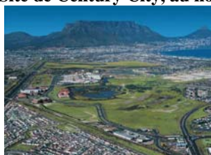
Figure 3. Site de Century City, au nord du Cap