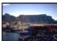
Figure 2. Victoria and Albert Waterfront (site et extérieurs)

Installé dans un port toujours actif, proche du centre ville et de ses flux, facilement accessible par les transports en commun, le V&A Waterfront est un morceau de territoire de plus en plus ouvert : à la ville, puisque les constructions les plus récentes comblent les vides urbains ; au paysage, puisque le mall juxtapose lieux ouverts et lieux fermés ; à un public divers ; au monde, puisque 25 % environ des visiteurs sont des touristes étrangers.