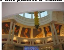
Figure 7. Intérieur d'une galerie à Canal Walk (Century City)

Canal Walk à Century City regorge de références à l'Italie, à la France et à l'ensemble des pays méditerranéens, symbole de lieu proche du paradis. Le centre est fortement inspiré d'exemples étrangers et là aussi, l'Afrique du Nord est présente avec les deux grandes portes en forme de pyramide et la double tête de Sphinx qui accueillent les visiteurs. Les galeries et allées intérieures prennent parfois l'allure d'un musée (Figure 8).