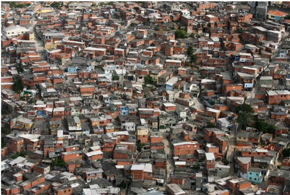
Photo 5 Favela de São Paulo