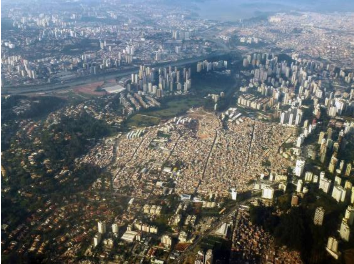
Photo 2 Paraisópolis

Profitons à notre tour de l'anecdote pour pousser la réflexion. La photo a été prise à Paraisópolis, un bidonville de São Paulo enclavé dans le quartier chic de Morumbi, où se situe le palais du gouverneur de l'État.