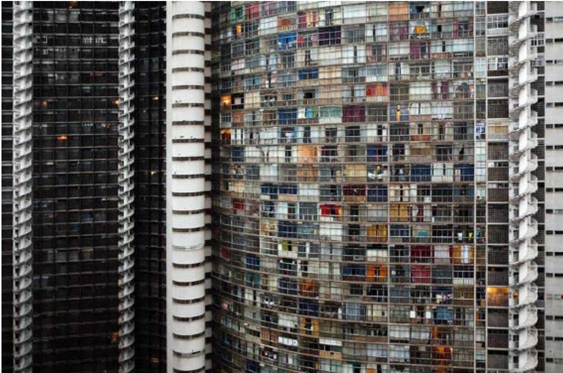
Photo 7 Immeuble du centre de São Paulo