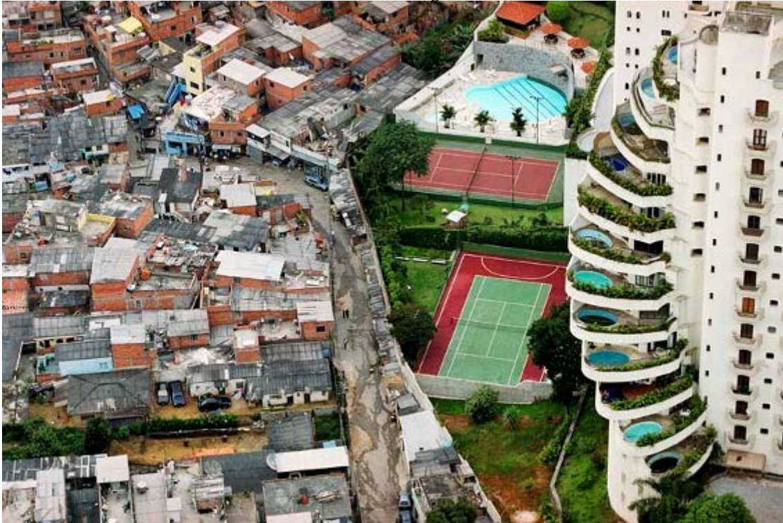
Photo 1 Inégalité