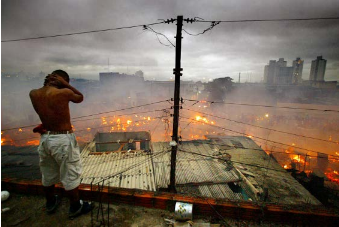
Photo 8 Incendie de favela à São Paulo