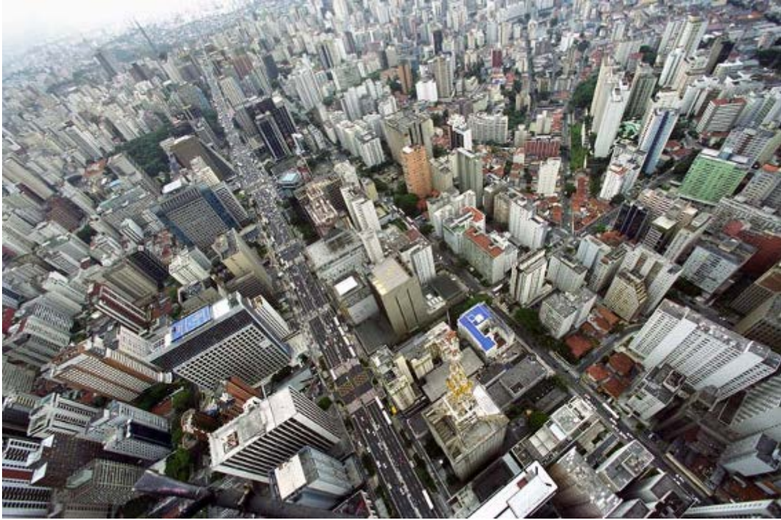
Photo 6 L'Avenida Paulista, au centre de São Paulo