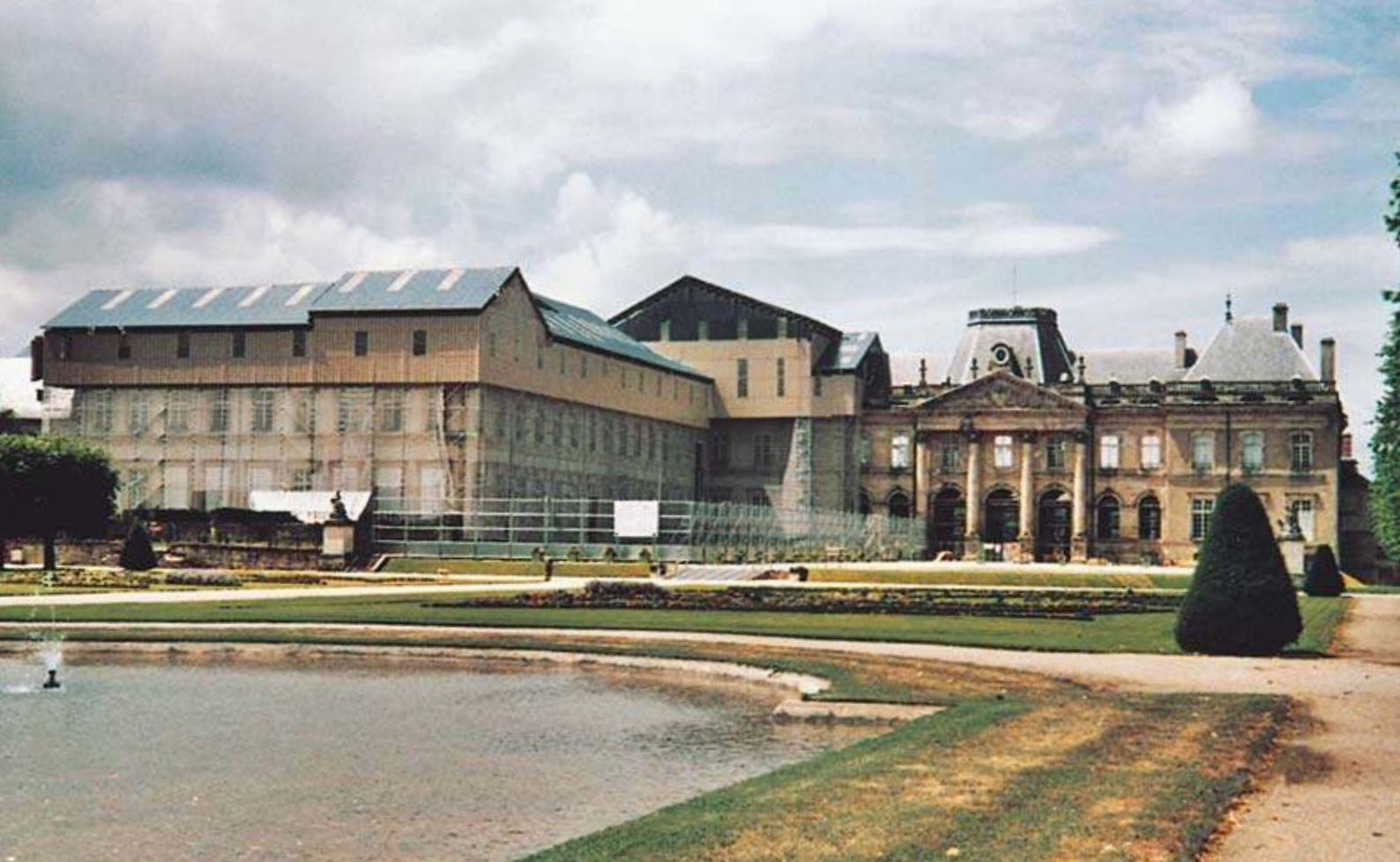
Le château de Lunéville vu du parc des Bosquets. L'aile sud incendiée, en cours de restauration, est recouverte d'un immense toit de tôle, « parapluie » qui abrite ce qu'à Lunéville on a qualifié de « plus grand chantier patrimonial en Europe », juillet 2005.

certes spécialistes du sens, ne sont pas les seuls à pouvoir faire valoir une capacité d'expertise. J'emploie « expertise » dans un sens non restrictif : la proximité avec un objet du passé ou avec ce qu'il représente (les valeurs de la valeur) donne, sans présumer de son expression, une capacité à s'en faire le porte-parole, à engager une action visant sa mise en valeur. En d'autres termes, la capacité d'expertise est adossée à une relation à un objet et définit la position du locuteur, elle n'est en aucun cas adossée, contrairement à son sens courant, à une profession et aux compétences qui lui sont associées (Trépos 1996). Selon cette acception, l'expertise est un ressort d'intelligibilité du phénomène des « émotions