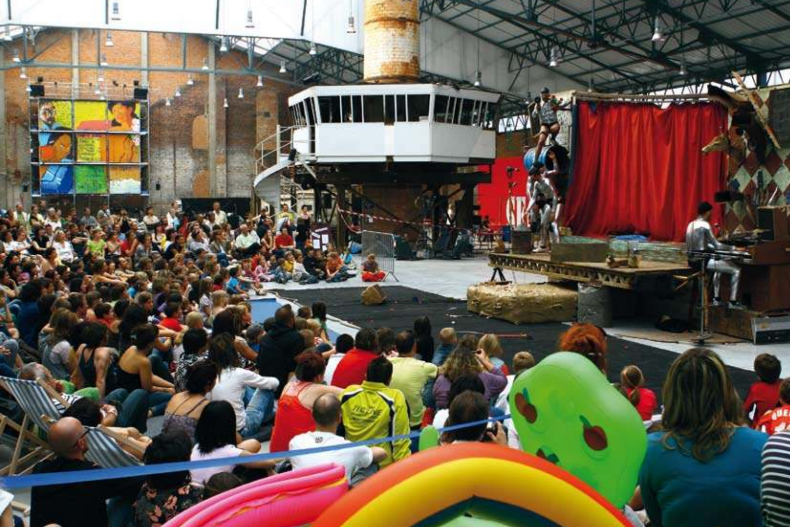
Friche culturelle : spectacle dans l'ancienne halle de l'usine verrière de Meisenthal, lors du festival de théâtre «Demandez-nous la Lune!», mai 2009.

le projet vient réactiver, pour tous l'attachement se construit dans l'action dont elle est désormais indissociable. Cet attachement impose aux humains une conscience vive du respect de l'intégrité historique de la halle: «À nous de faire attention à ce qu'on la respecte», dit l'un des responsables. Vient un moment dans l'histoire du collectif où grandeur artistique et grandeur domestique s'épaulent mutuellement, au point a priori improbable que des amoureux du rock se transforment en conservateurs de patrimoine; et au prix d'un paradoxe, mais qui n'est qu'apparent: avant sa rénovation au début des années 2000, soit pendant une quinzaine d'années d'utilisation, la halle avait une très mauvaise acoustique.