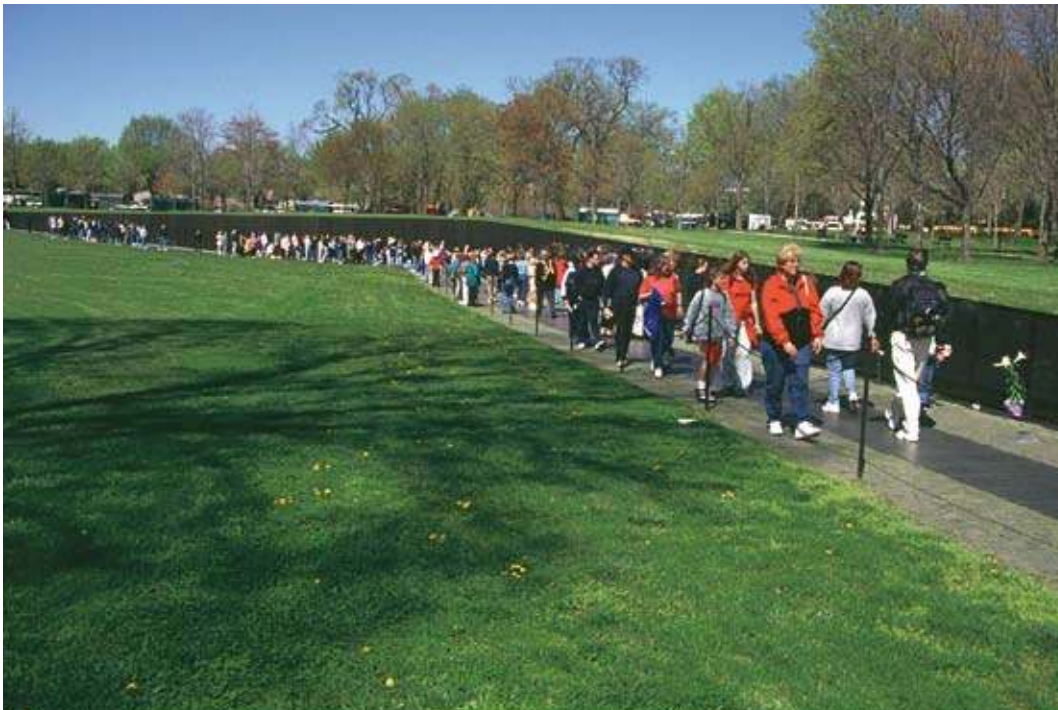
Monument de la douleur et du deuil, propice au recueillement par sa forme horizontale et semi-enterrée, le Vietnam Veterans Memorial à Washington est l'un des plus visités des États-Unis.

dimension qui répond à cette attente et l'actualise : un mur de granit noir et lisse, miroir réfléchissant enfoncé dans la terre et la zébrant comme une cicatrice, portant les noms des quelques 58 000 morts et disparus américains, conçu par une jeune artiste, Maya Lin. Comme pour souligner l'importance de l'intéressement artistique de l'intention monumentale, des controverses et des débats vifs ont émaillé la construction du mur. Tous soulignaient que le projet rompait avec les codes esthétiques et mémoriels en matière d'art commémoratif : controverse (avec des journalistes et des critiques d'art) sur l'art minimaliste, controverse (avec des vétérans) sur la capacité de cette œuvre abstraite à porter la mémoire de la guerre et, conjointement, sur la légitimité de sa créatrice à se faire le porte-parole des morts et des vétérans. Or, ces querelles se sont évanouies dès l'inauguration en 1982, devant ce qui s'est révélé être la puissance de l'expérience du mémorial. Réalisant un transport de réparation du corps du vétéran à la nation, le monument du deuil est devenu le monument de