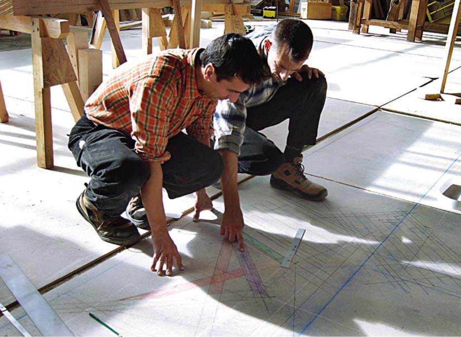
Le savoir-faire célébré comme patrimoine culturel immatériel : l'art du tracé dans la charpente française.

les musées, la liste devient le contexte des objets qui y figurent (Kirshenblatt-Gimblett 2006: 170). Suivant une pente qui serait fatale, la politique patrimoniale internationale, même recentrée sur l'immatérialité culturelle, serait vouée à ne produire que du métaculturel ( ibid. ). Enfin, le déplacement sur les acteurs eux-mêmes ne se fait qu'au profit de l'idée de création collective, qui tend à figer la culture et ne concourt pas à rendre compte de sa « nature intrinsèquement évolutive » ( ibid. : 180) : définis comme des « détenteurs, transmetteurs et porteurs de tradition », les praticiens ne sont que des médiateurs passifs ou des véhicules dépourvus d'intention ou de subjectivité ( ibid. : 179).