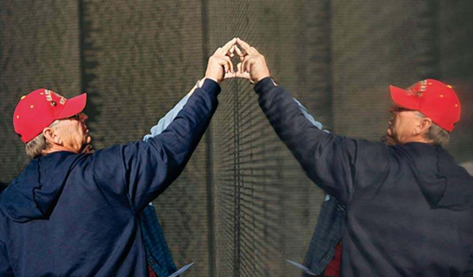
Le « pèlerin », vétéran, parent, ami, touche du doigt le nom du mort, gravé parmi les milliers d'autres dans lesquels les vivants se reflètent. « Vietnam Memorial Anniversary », Washington, 2007.

d'un « arraisonnement » par neutralisation et par esthétisation ? Il agrège, réunit les adversaires d'hier (les pro et les anti-guerre), accueille les discours conflictuels sur la guerre, il définit ce qui doit être dit, publicisé, transmis et ce qui peut être tu, éludé, mis en réserve (les trois millions de morts vietnamiens, par exemple). Il est un écran, suggère Marita Sturken ( ibid. : 44), aux deux sens du terme : on s'y projette, il protège. Ce succès appelle cependant une interrogation. La plupart des analyses produites datent des années 1980-1990. Qu'en est-il aujourd'hui ? Qu'en sera-t-il dans dix ou vingt ans ? Jusqu'à quand le monument vivant, lieu de pèlerinage, coexistera-t-il avec le monument historique ? Nul ne peut le dire. Si la performance du mémorial ne peut être anticipée, pour remarquable qu'elle soit, la communauté qu'il crée n'est pas durable. Elle est fragile et sujette à des recompositions. De même que varie l'adéquation entre l'intention et la réception. Finalement, rien n'est plus hasardeux que de confier le soin de transmettre à un monument. L'espace est parsemé de monuments