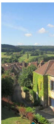
Moutiers-au-Perche (61). Érosion démographique assurée pour l'Orne, au solde migratoire négatif et au solde naturel nul.

Dans une France qui continue à gagner des habitants, la distribution spatiale de la population évolue de façon de plus en plus contrastée . Le caractère plurifactoriel des évolutions de peuplement engendre pas moins de quinze évolutions démographiques différentes. Certes, comme auparavant, le jeu des différences d'espérance de vie et de fécondité selon les départements concourt également à des effets divergents. Des processus des décennies précédentes sont encore à l'œuvre, comme la litturbanisation qui favorise les territoires atlantiques et méditerranéens, l'héliotropisme positif qui défavorise le Nord ou la para-urbanisation qui avantage l'Eure et la Seine-et-Marne, proche de Paris, ou l'Isère, limitrophe du Grand Lyon 10 . Mais aucun effet métropole ne se constate 11 . En