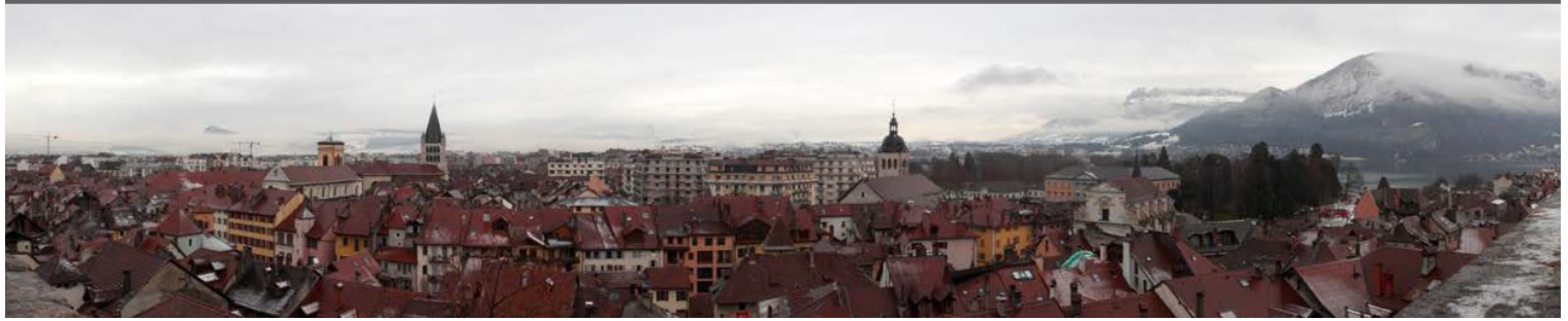
Annecy (74). La Haute-Savoie, l'un des plus fort taux d'accroissement démographique.